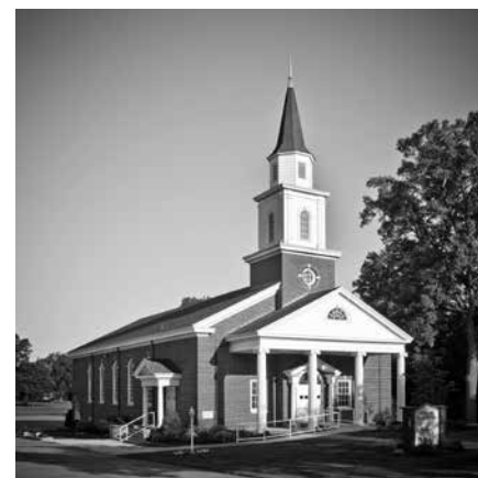
De NRC van Grand Rapids.

Zacharia krijgt de verklaring, hemels onderwijs, na beledenen te hebben de bedoeling niet te weten. 'Toen antwoordde Hij, en sprak tot mij, zeggende: Dit is het woord des HEEREN tot Zerubbabel, zeggende: Niet door kracht noch door geweld, maar door Mijn Geest zal het geschieden, zegt de HEERE der heirscharen' (Zach. 4:6). De Heere Zelf zal voor de voltooiing van de bouw van Zijn huis zorgen. Zeker, er is een grote berg van onmogelijkheden, ook van schuld, maar: