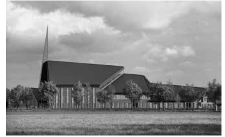
Kerkgebouw Gereformeerde Gemeente Scherpenzeel.

Na een voorbereidingsperiode van vijftien jaar werd op dinsdag 28 mei de nieuwe kerk in Scherpenzeel officieel in gebruik genomen.