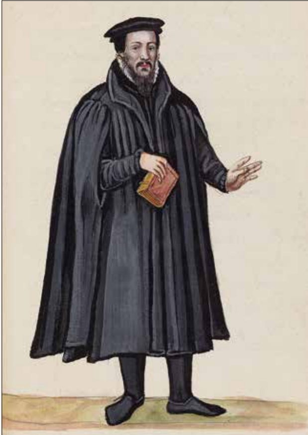
Caspar Olevianus (1536-1578)