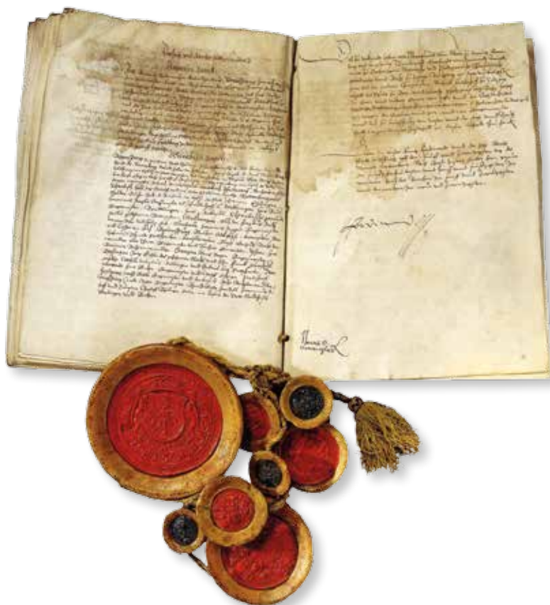
Oorkonde van de Augsburgse Godsdienstvrede, 1555