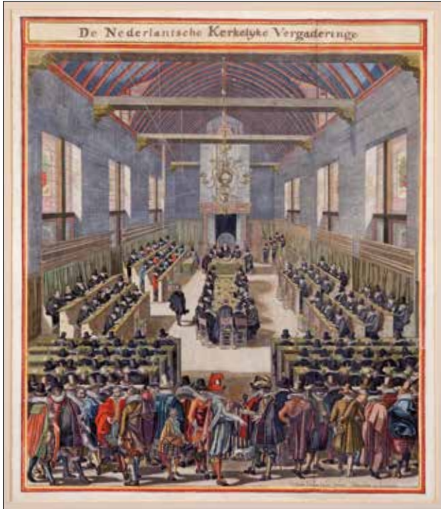
Synode van Dordrecht 1618-1619

O p 27 november 1618 kwam op de Synode van Dordrecht de prediking van de Catechismus nadrukkelijk aan de orde. Voorzitter Bogerman stelde twee vragen aan de synode: Ten eerste: Of de Synode niet van oordeel is dat elke zondagmiddag uit de Catechismus behoort gepreekt te worden? Vervolgens: Hoe kan dit tot stand komen?