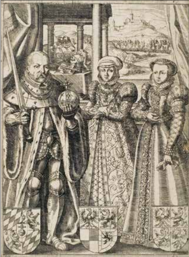
Keurvorst Frederik III (1515-1576) met zijn vrouw Maria, dochter van markgraaf Casimir van Brandenburg-Kulmbach (1519-1567) en Amalie, dochter van graaf Gumberth IV van Neuenahr (1536-1602).

Lutherse predikanten moesten zwijgen of zich aanpassen. Die dit weigerden, werden uit hun ambt ontzet.