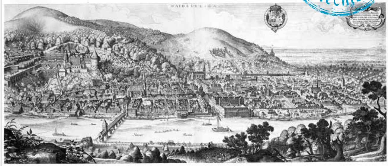
Gezicht op het slot en de stad Heidelberg, panorama vanuit het noorden.

E en wonderlijke naam draagt de Zaligmaker. Hij is Christus, Gezalfd. Waarom? Omdat Hij van God de Vader verordineerd is en met de Heilige Geest gezalfd. Deze korte zin uit Zondag 12 laat zien dat het hart van de Heidelberger ligt bij het werk van een Drie-enig God. Zo kreeg de kerk een troostboek voor hen die zuchten om verlossing, maar geen handen hebben om die aan te nemen.