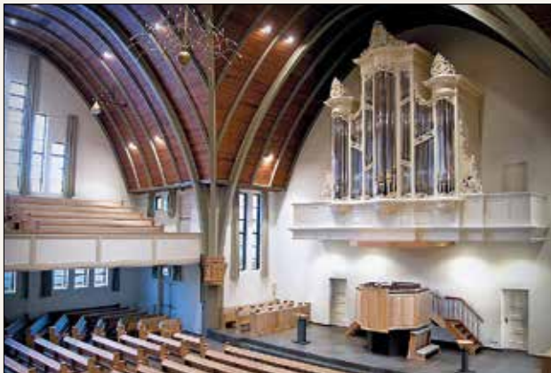
In de Gereformeerde Gemeenten wordt iedere zondag de Heidelbergse Catechismus behandeld.

Ik kan mij laven aan het onderzoeken van de Catechismus. Daar weet ik me zo veilig bij. Een onmisbare uitleg daarbij is "Het Schatboek" zoals het door Festus Hommius is geredigeerd. Daar horen we de verklaring in van predikanten uit de tijd van Ursinus en kort daarna. Opvallend is in deze verklaring onder meer dat vlak voor Zondag 7 er een grote uitwerking is gegeven van het Verbond Gods en het Evangelie. Dit geeft zo de bevindelijke gang aan van het leven der genade. Hoe komt de zondaar aan die enige troost waarvan sprake is in Zondag 1? Ds. Hellenbroek zegt dat de Heere verbondsgewijze werkt. In het stuk der ellende leert Gods kind(!) hoe de eis van het werkverbond is gebleven en hoe hij nooit meer in die weg terug kan keren tot God. In het buigen onder Gods rechtvaardige gerichten, dat gepaard gaat met een verzuchting en liefde tot verheerlijking van Gods recht, komt plaats voor de openbaring van het genadeverbond in Christus. Dáárom behandelt Zondag 7 niet allereerst het oprecht geloof, maar benoemt deze zondag eerst de twee verbondshoofden Adam en Christus.