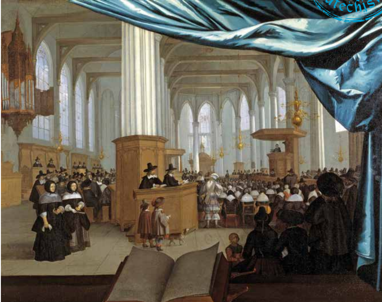
Interieur van de Nieuwezijdskapel in Amsterdam tijdens de kerkdienst. Schilderij van de Amsterdamse schilder H.J. van Baden, 1658.