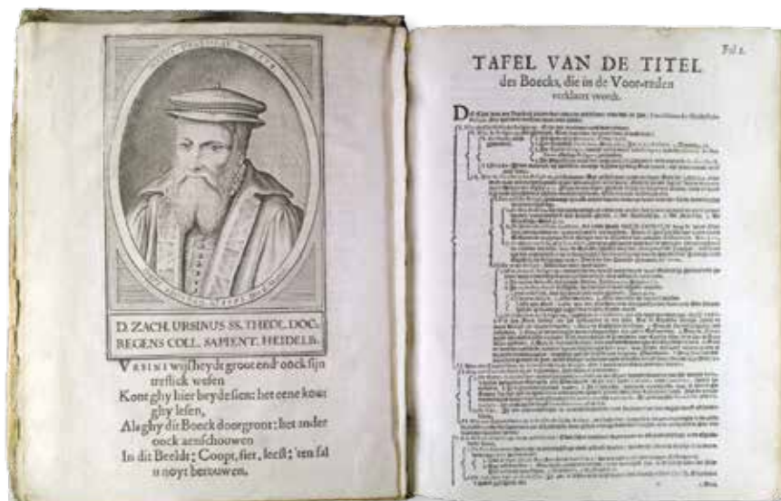
Nederlandse uitgave van Zacharias Ursinus' Corpus doctrinae Christianae ecclesiarum , het zgn. Schatboek , Amsterdam 1650, met afbeelding van Ursinus.

Direct zet de Catechismus in met de 'enige troost, beide in het leven en sterven'. Dat is uiteindelijk het hart van de zaak. Kort en bondig wordt dan uiteengezet wat de inhoud van die enige troost is en hoe een mens aan die troost komt. De verdere uitwerking van de inhoud van die troost komt dan in de volgende zondagen aan de orde. Daarin hebben ook de bekende drie stukken hun plaats, ellende, verlossing en dankbaarheid. Dat is de weg om tot die troost te komen, maar ook om uit die troost te leven.