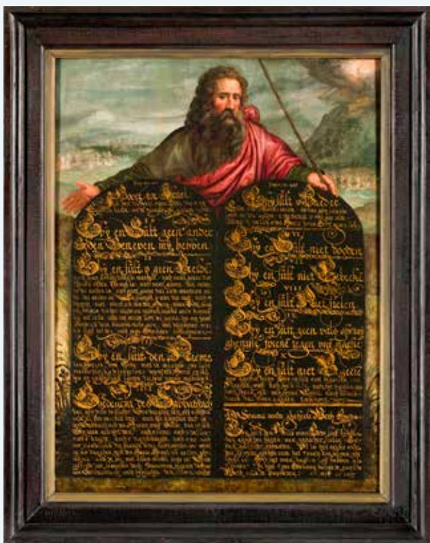
In het calvinisme van de zestiende en zeventiende eeuw werd het thema van het verbond besproken. God sloot een verbond met Mozes en gaf hem daarbij de Tien Geboden. Op dit schilderij toont Mozes de tafels van de wet met daarop de Tien Geboden.

Soms valt daarbij de nadruk op wat de Heere verbiedt (HC 96), dan weer wordt uitgewerkt wat de Heere eist (HC 103). Soms wordt gewezen op de gezindheid waaruit het handelen opkomt (HC 106), dan weer wordt concreet aangewezen wat wel of niet mag (HC 101). Doperse dwalingen worden weerlegd (HC 102), de beeldendienst veroordeeld (HC 97), de dienst des Woords nadrukkelijk onderstreept