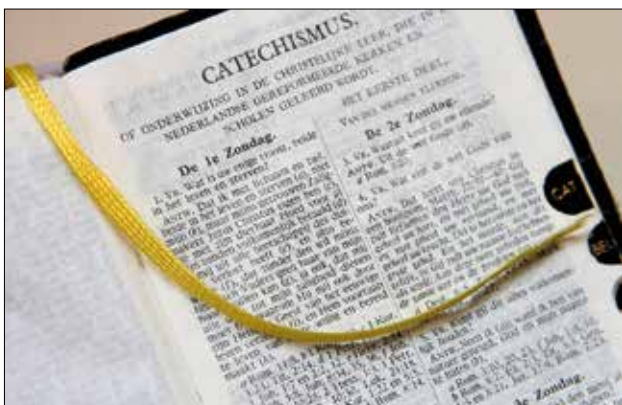
Vraag en antwoord 1 met de verwijsteksten.

Nu is het voor ons bijna niet te doen om iedere tekst die de dominee noemt gauw even op te zoeken en na te lezen. We kunnen wél iets anders doen. Voordat we naar de kerk komen om een Catechismuspreek te beluisteren, kunnen we alvast de teksten opzoeken die onder de be-