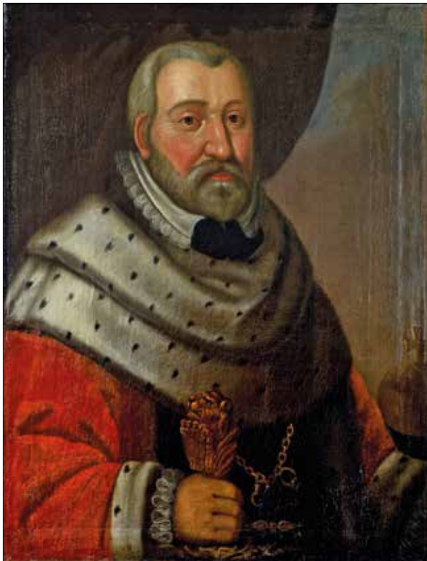
Portret van keurvorst Frederik III, ook genoemd de Vrome, van de Palts, 1515–1576, keurvorst van 1559–1576

T ijdens de Rijksdag te Augsburg (1566) moet het zijn gebeurd. Lutheranen en roomsen hadden Frederik III aangeklaagd wegens calvinisme. Hij had de Heidelbergse Catechismus ingevoerd in de Pfalz. Toen hij midden in die vijandige vorstenvergadering volhardde in z'n belijdenis moet één van hen, August van Saksen, hem op de schouder hebben geklopt en gezegd: 'Frits, jij bent vromer dan wij allen!' Zo werd Frederik III tot Frederik de Vrome.