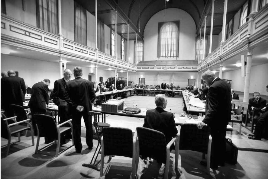
Op de komende Generale Synode, D.V. 18 en 19 september te Utrecht, zal er ook gesproken worden over “zoeken naar kerkelijke eenheid”.

landse Geloofsbelijdenis in artikel 27: ‘Wij geloven en belijden een enige katholieke of algemene Kerk, dewelke is een heilige vergadering der ware Christgelovigen, al hun zaligheid verwachtende in Jezus Christus, gewassen zijnde door Zijn bloed en geheiligd en verzegeld door den Heiligen Geest’.