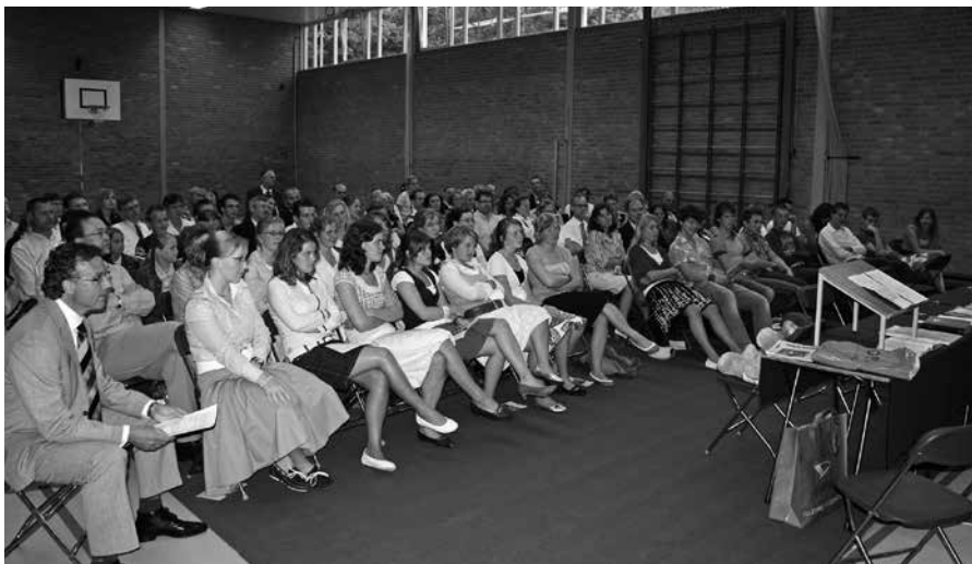
Afscheid nemen doet pijn. Pijn die verzacht kan worden door een vast vertrouwen op Gods vaderlijke leiding en zorg.

Wat echter ook niet mag ontbreken, is een gebed om vergeving van alles waarin we tekort geschoten zijn. Tekort geschoten ten opzichte van elkaar en ten opzichte van God. Afscheid nemen doet terug zien op eigen gebrek en tekort. Wat over blijft is het gebed van Mozes, de man Gods: 'En de lieflijkheid des HEEREN onzes Gods zij over ons; en bevestig Gij het werk onzer handen over ons, ja, het werk onzer handen, bevestig dat'.