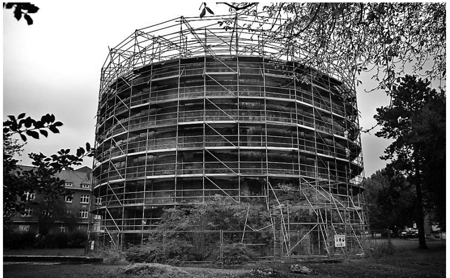
De muur van het kasteel in Doornik waar over, in de nacht van 1 op 2 november 1581, het pakje geworpen werd.

Waarom moest Guido de Brès zich eigenlijk verdedigen tegen de beschuldiging dat de hervormden een revolutie wilden ontketenen? Het was een gevolg van het feit dat er inderdaad rebellen zaten onder hen die Rome de rug hadden toegekeerd. Onder een godsdienstige vlag streefden deze zogenoemde Anabaptisten of Wederdopers naar een absolute vrijheid. Als “pelgrims naar het nieuwe Jeruzalem” verwierpen zij alles wat te maken had met deze wereld en de bestaande orde: het gezag van de kerk, de ambten, de kinderdoop, de burgerlijke regering, de rechtbank, de eed en soms zelfs de instelling van het huwelijk. Dit alles was natuurlijk heel bedreigend voor de staat. Omdat de maatschappij in grote verwarring verkeerde, veegde de regering de gereformeerden gemakshalve op één hoop met deze oproerkraaiers. Het is goed ons dit te realiseren als we het hebben over de Nederlandse Geloofsbelijdenis. Wij denken dikwijls dat de hervormers maar tegen één