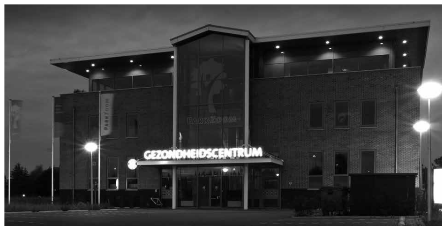
Somberheid en overtuiging vragen om een voorzichtige, maar soms ook om een doortastende aanpak.

Overtuiging van zonde vraagt ook om geestelijke wijsheid in de omgang. De wijsheid die de Catechismus aan de dag legt in antwoord 12. De vraag is: 'Aangezien wij dan naar het rechtvaardig oordeel Gods tijdelijke en eeuwige straf verdiend hebben, is er enig middel, waardoor wij deze straf zouden kunnen ontgaan en wederom tot genade komen?' Het is de vraag van een overtuigde zondaar. En het antwoord is - dat hadden wij misschien niet verwacht: 'God wil dat aan Zijn gerechtigheid genoeg geschiede'. Het is waar, hier gaat het ook om het onderwijs in de zaligmakende leer - is er nog een weg mogelijk tot verzoening? - maar hier klinkt ook de geestelijke wijsheid door van een vaardige arts, die niet zomaar een pleister plakt en zegt: de wond is al bezig te genezen. Petrus heeft weet van de verslagenheid van het hart van de pinksterlingen als hij tegen hen zegt: Geloof in de Heere Jezus Christus.