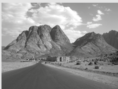
De berg Horeb

Van het zomerpaleis van Achab in Jizreël, te voet het gebied van de tien stammen uit, de twee stammen door, naar het zuiden, de woestijn in. Dat is een heel eind. Daarvoor had Elía al gelopen van de Karmel naar Jizreël. Toen goedsmoeds, want 'de hand des HEEREN was over hem' (1 Kon. 18:46). Maar na de dreiging van Izébel dat hij binnen een dag omgebracht zou worden, is nu alle moed in zijn schoenen gezonken. Hij had gedacht dat het zo anders zou gaan. Dat de Astartebomen zouden worden weggerukt door een stormwind. Dat de heidense tempels in puin zouden vallen door een aardbeving. Dat alle vijanden van God en Zijn volk door vuur verteerd zouden worden. Dat het volk de uitgesproken belijdenis zou gestand doen. Dat... En wat gebeurt er nu? Wat is er nu na de Karmel veranderd? Helemaal