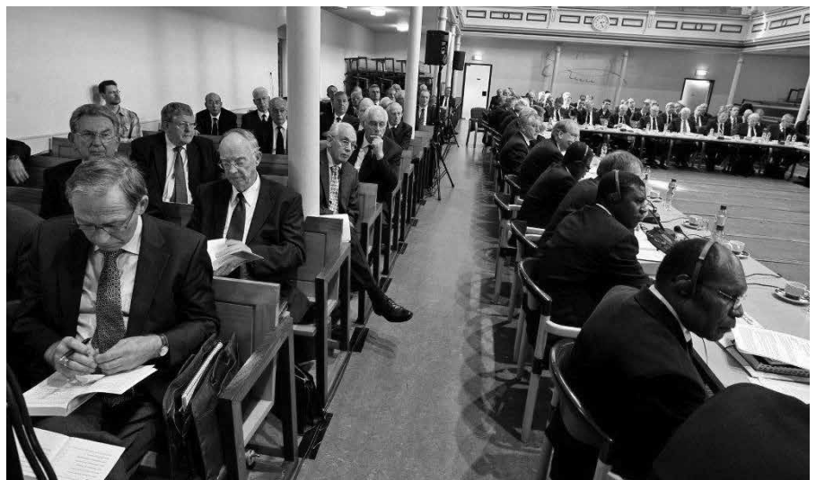
Eens in de drie jaar vergadert de generale synode van de Gereformeerde Gemeenten, in het kerkgebouw van de gemeente Utrecht.