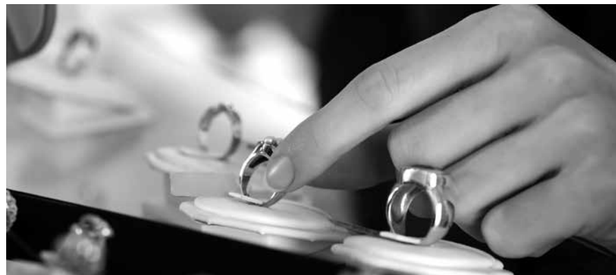
De Heere vervulde in die tijd ook mijn begeerte om als zilversmid in mijn eigen zaak te gaan.

En wat deed de Heere in Zijn onbegrensde liefde? Ik maakte alles gereed wat ik er toe nodig had, nam een aanvang met het werk, en het was mij even alsof ik het van mijn jeugd af geleerd had. O, moest ik hier wel uitroepen, Wie en wat is God voor Zijn volk en hoe wondervol zijn Zijn wegen, die Hij houdt met Zijn kinderen. En wat het grootste wonder nog was, was dat juist die zaak voor mij tot rijke zegen was in mijn arbeid, daar het ruime winst afwierp, en ik er twaalf jaar lang mijn bestaan in gehad heb, en daarom: Welgelukzalig is hij, die den God Jakobs tot zijn Hulp heeft, wiens verwachting op den HEERE zijn God is. Psalm 146:5'