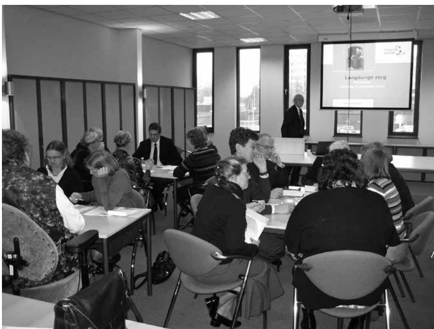
Helpende Handen wil er zijn voor mensen met een langdurige of levenslange beperking.