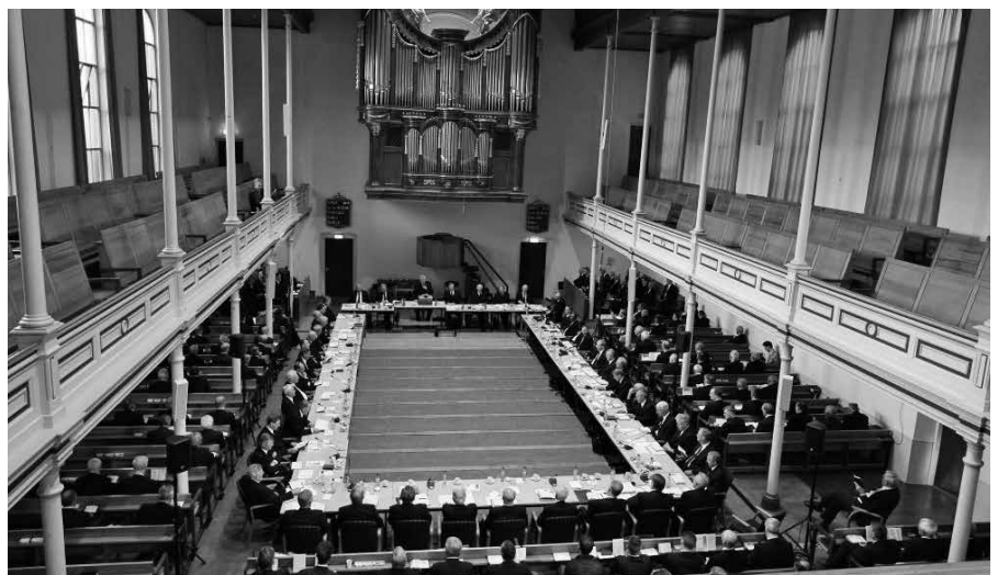
Eens in de drie jaar vergadert de generale synode van de Gereformeerde Gemeenten, in het kerkgebouw van de gemeente Utrecht.