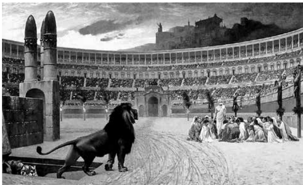
Met de komst van keizer Constantijn in 306 na Chr. eindigden de grote vervolgingen.

In de eeuwen daarna volgden tien perioden van vervolging. Aanvankelijk betrof dit lokale incidenten, die in Rome waren begonnen en zich vervolgens in het hele Romeinse Rijk voordeden. Vanaf keizer Decius werd de christenvervolging meer systematisch van aard (ca. 250-251 na Chr.). Met de komst van keizer Constantijn in 306 na Chr. eindigden de grote vervolgingen. Als we willen weten hoe christenen elkaar in deze tijden van vervolging hielpen, kunnen we vooral terecht bij de geschriften van de apostolische vaders (ca. 90-160 na Chr.) en van de apologeten (vanaf ca. 160 na Chr.). Deze kerkvaders schreven brieven en verhandelingen aan degenen die vervolgd werden om hen te bemoedigen.