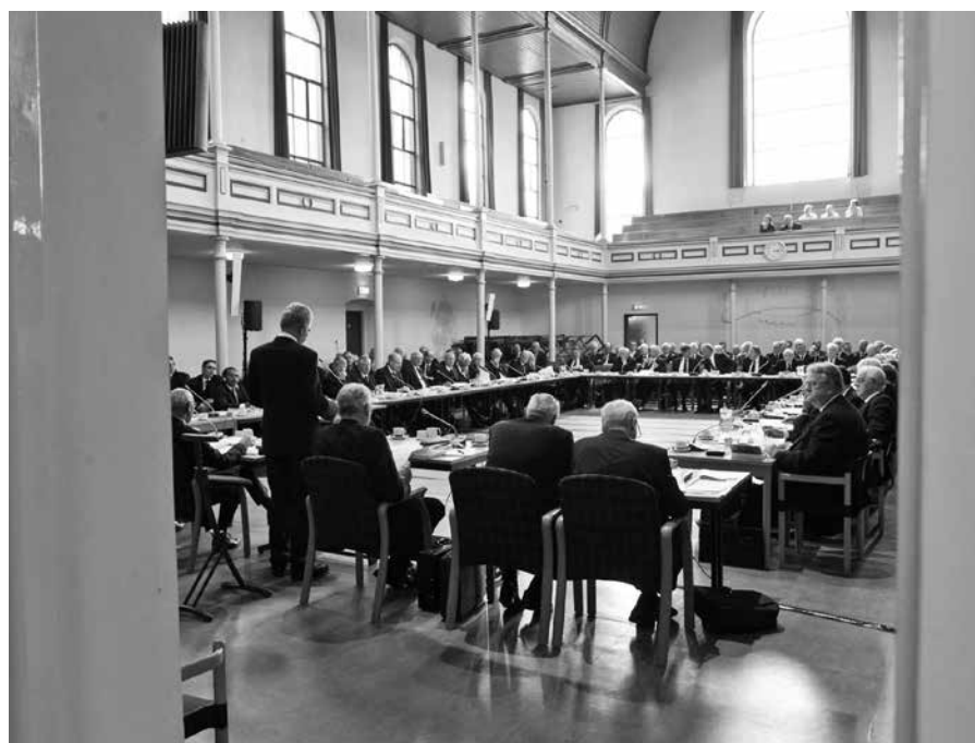
Vervolgens buigt de Synode zich over het rapport van het deputaatschap Bijbelverspreiding.

Het is meer en meer het beleid van het deputaatschap om op hoofdlijnen te besturen, waarbij het werk steeds meer classicaal ingebed wordt. Dit zien we naast de steun uit de classes voor de bestaande posten ook terug in de classicale projecten in Rotterdam, Den Haag en Leidsche Rijn. Er wordt vanuit de synode ook een punt aan de orde gesteld wat meerde-