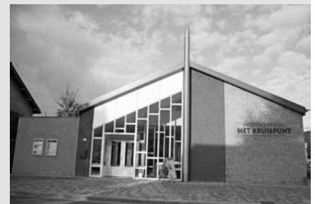
Inloopcentrum 'Het Kruispunt'