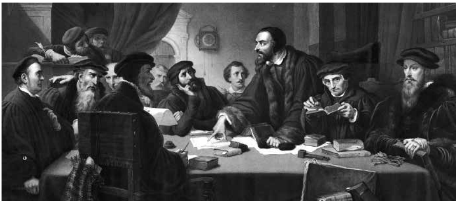
Calvijn als voorzitter van de raad van predikanten.

Dan wijzen wij hem op de enige grond van behoud: de barmhartigheid Gods, zoals zij ons in Christus is geopenbaard, want alles, wat tot ons heil dient, is in Hem vervuld. Dewijl dan alle sterfelijke mensen voor God als zondaren veroordeeld liggen, noemen wij Christus onze enige gerechtigheid; met Zijn gehoorzaamheid heeft Hij onze overtredingen uitgedelgd,