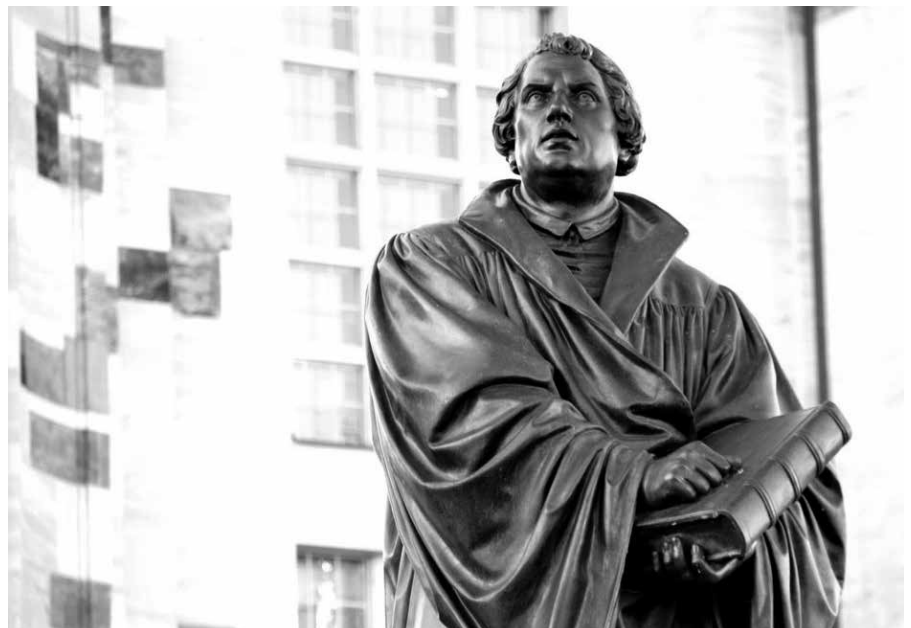
Bij Maarten Luther gaat het werk van de wet vooraf aan en is heenleitend tot het werk van het Evangelie.