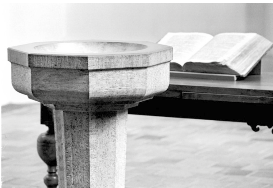
Bij het samenstellen van een boek over de geloofsleer wordt veelal de volgorde gebruikt die we bijvoorbeeld aantreffen in de Nederlandse Geloofsbelijdenis.

Er zijn echter bij deze omschrijvingen van de geloofsleer ook vragen te stellen. Ds. Kersten bijvoorbeeld - in navolging trouwens van Bavinck - om-