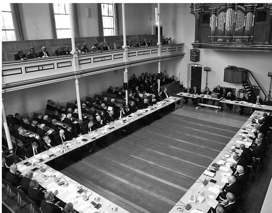
Wij stichten geen kerken. Dat is geen mensenwerk, maar het werk van de Heere.