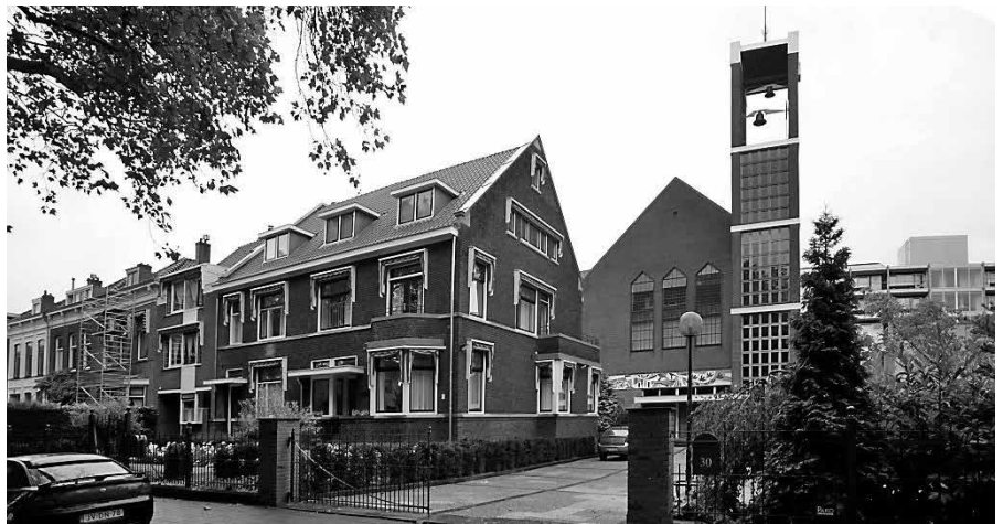
In de theologische school aan de Boezemsingel is de bibliotheek gevestigd.

Kerkenraad Geref. Gem. Apeldoorn: H. Folmer, e.a. / Wat zijn u deze stenen? 75 jaar Gereformeerde Gemeente Apeldoorn. 1937-2012.