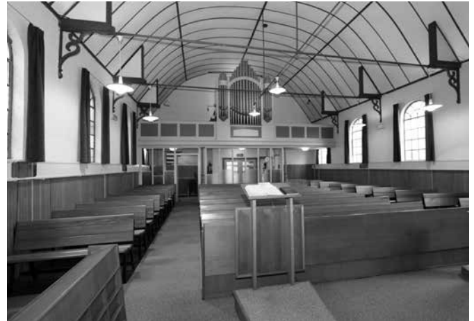
Exterieur en interieur van de Gereformeerde Gemeente Hellevoetsluis.