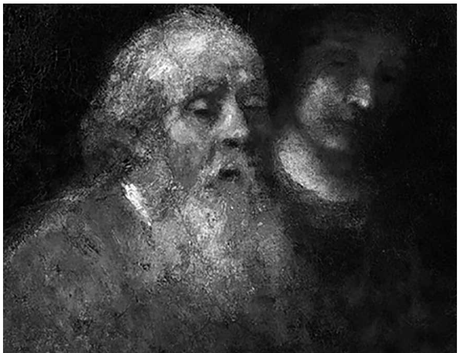
Simeon stak zijn lege armen uit en ontving dit Kind als een Gave Gods.