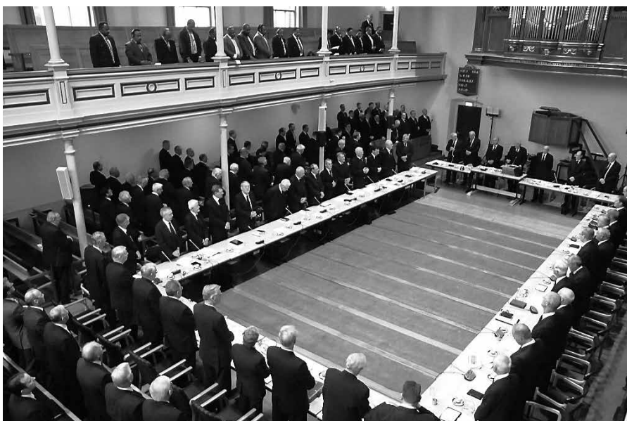
Er mag iets ervaren worden van een innerlijke verbondenheid in de nood en in de schuld van de kerk.

Hoe komt het - zo wordt er gevraagd - dat schuld geen schuld is in het leven van Gods Kerk? Natuurlijk, dit rapport vraagt om bezinning op datgene wat we in een rechte weg mogen en kun-