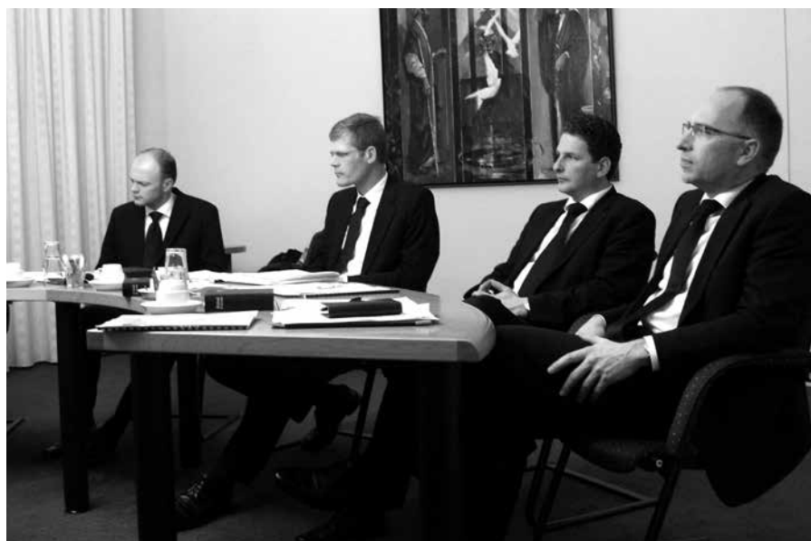
De voorziening in de ambten moet steeds biddende om de leiding des Heeren verricht worden.

De gemeente heeft ook een verantwoordelijkheid. De mansledenvergadering heeft te kiezen uit de door de kerkenraad gestelde kandidaten. Ten aanzien van hen die gekozen zijn en hun verkiezing hebben aanvaard, heeft de gemeente - zowel mannen als vrouwen - het recht van approbatie. Dat houdt in dat belijdende leden wettige bezwaren kunnen indienen tegen hen die gekozen zijn en straks bevestigd zullen gaan worden. Het is