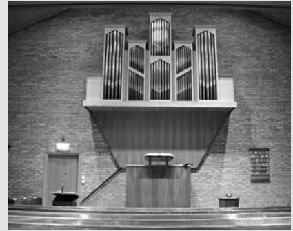
Exterieur en interieur van de Gereformeerde Gemeente Mijdrecht.

zondags tweemaal een preek gelezen werd. Maar de sacramenten konden er niet bediend worden. Zo kwam het dat men zich in 1927 aansloot bij de Gereformeerde Gemeenten.