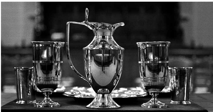
'Mijn vlees is waarlijk spijs en Mijn bloed is waarlijk drank.'

De hele gemeente voelt dat het een plechtig ogenblik is als de predikant de preekstoel afkomt, een gebed bij de avondmaalstafel doet en vervolgens de doeken van het avondmaalsstel wegneemt. Dan worden de tekenen in alle eenvoud zichtbaar. Op de schaal het brood dat gebroken zal worden, de kan waaruit de wijn gegoten zal worden in de twee bekers. De bediening van het Heilig Avondmaal gaat beginnen.