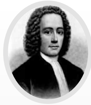
ds. Ralph Erskine 1685 - 1752

Volgende week deel 3: de nabetrachting op het Heilig Avondmaal.