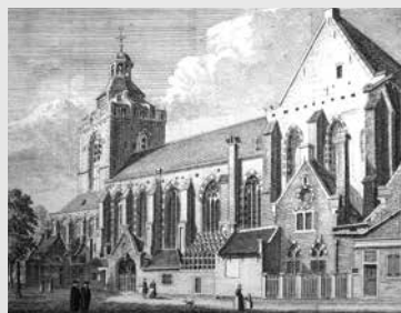
De Buurkerk te Utrecht waar Justus Vermeer naar de kerk ging.