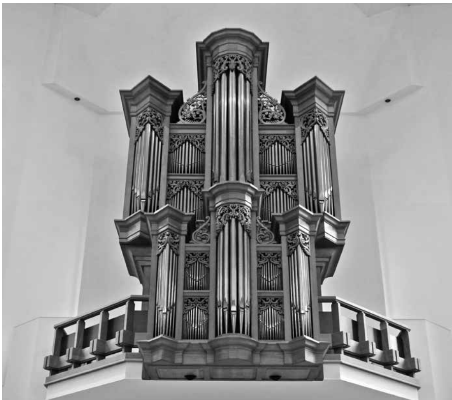
Spelen naar het hart van Jeruzalem is gelukkig niet gebonden aan één bepaalde stijl. Foto: Het BAG-orgel in de Elimkerk te Amersfoort.