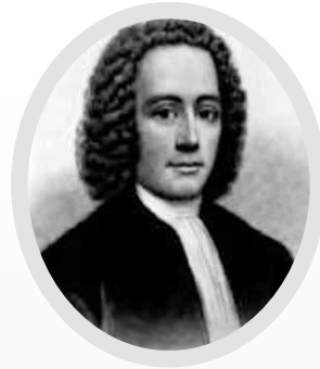
Ralph Erskine 1685-1752