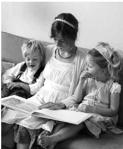
Ernstig wordt gewezen op de noodzaak van huisgodsdienst oefeningen.

Het eerste hoofdstuk handelt over het huwelijk. Daarin wijst Wittewrongel aan 'hoe voortreffelijk en uitnemend die staat door God is ingesteld om de huisgezinnen van de mensen van het begin van de wereld tot het einde toe op te richten en te bevestigen'. Beharigenswaardige dingen worden onder onze aandacht gebracht. Zo wijst hij er op hoe men een gewenste wederhelft kan vinden. Hoe belangrijk is het om te letten op de naam, die iemand heeft. Maar ook op de ogen, die als een spiegel zijn. Daarnaast op de wij-