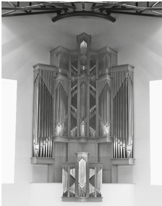
Ook de organist is een mens die af en toe positieve support nodig heeft. Foto: Het Boogaard-orgel in de Bethelkerk te Geldermalsen.

Om het contact met de kerkenraad niet te verliezen, is het gewenst dat organisten en kerkenraad periodiek met elkaar overleggen. Hoe vaak, dat zal plaatselijk verschillend zijn. Belangrijker is dat er van beide kanten de wil is om er een inhoudsvol gesprek van te maken. Dat kan door een bepaald aspect van het orgelspel te kiezen. Bijvoorbeeld het kwartiertje voor de dienst, het tempo van de gemeentezang of het orgelspel tijdens avondmaalsdiensten. En daarover met elkaar van gedachten te wisselen. Dat zal meer opleveren dan een ge-