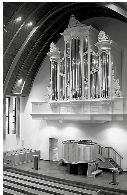
Interieur van de Gereformeerde Gemeente Krabbendijke.