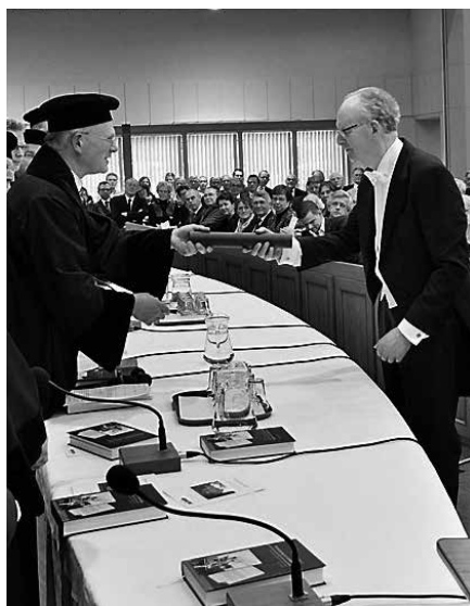
Onder grote belangstelling vond de promotie plaats.