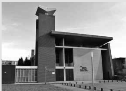
Exterieur Gereformeerde Gemeente Groningen.