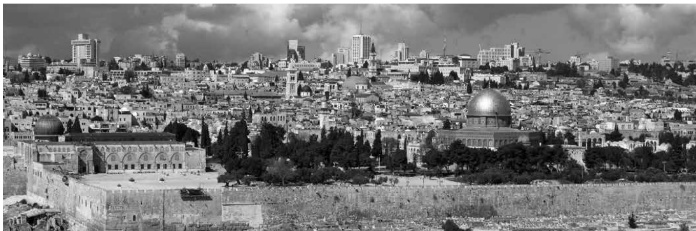
Zicht op Jeruzalem