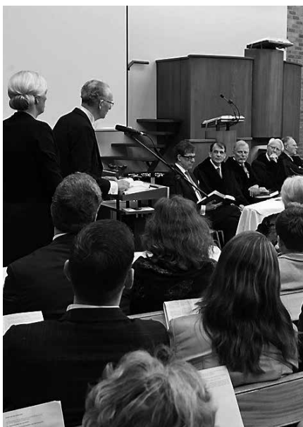
Onder grote belangstelling vond de promotie plaats.