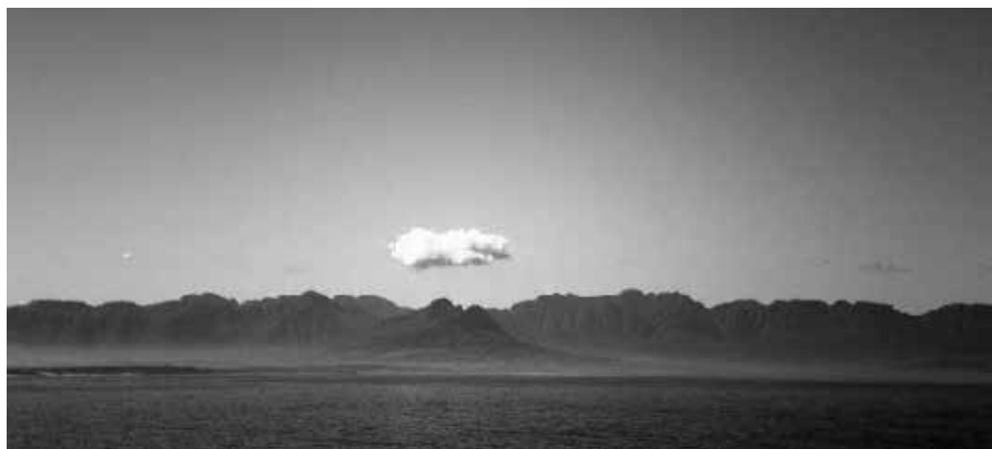
Een wolkje als eens mans hand?

Jonge kerkleden zijn vaker regelmatige kerkgangers dan ouderen. Ze hebben ook vaker veel vertrouwen in de kerken en zijn van mening dat je je aan alle voorschriften van de kerk hebt te houden. Ook beschouwen zij zich vaker als een gelovig of religieus mens, zien zij een sterk geloof als belangrijkste waarde in het leven, geloven zij zonder twijfel in God en onderschrijven zij alle kerkelijke leerstellingen (over de Bijbel, een leven na de dood, de hemel, de hel, de duivel). Die tendens naar "hertraditionalisering" is in