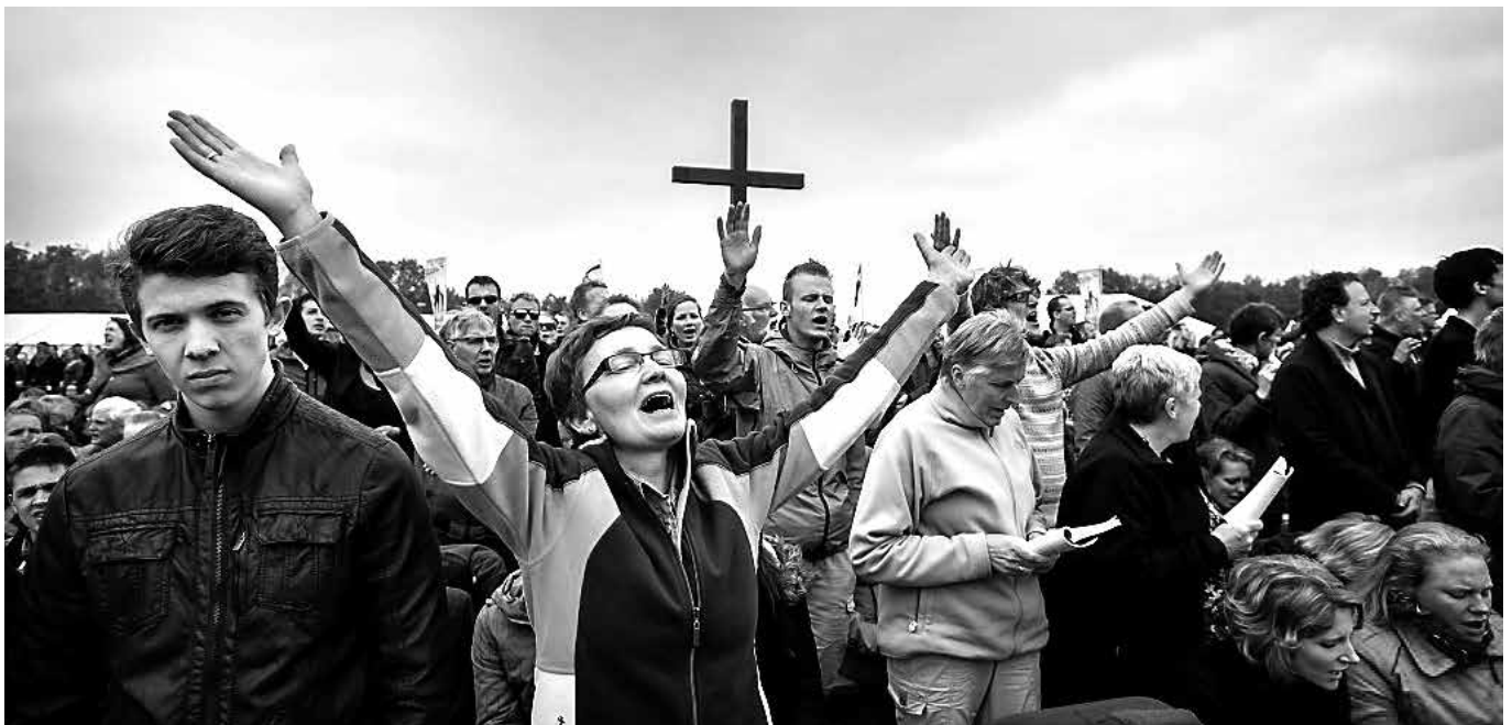
Ruim 55.000 mensen kwamen vorig jaar op de conferentie af, gehouden in de Flevopolder.