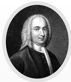
Ebenezer Erskine 1680-1754