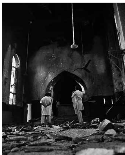
Vervolging manifesteert zich in de wereld

men op vrijdag. Dat is de islamitische heilige dag. Wie als moslim overgaat tot het christelijk geloof mag overigens verwachten dat - op last van de regering - na de inhechtenisneming de doodstraf wordt toegepast. Iran staat op nummer 8 van de ranglijst christenvervolging.