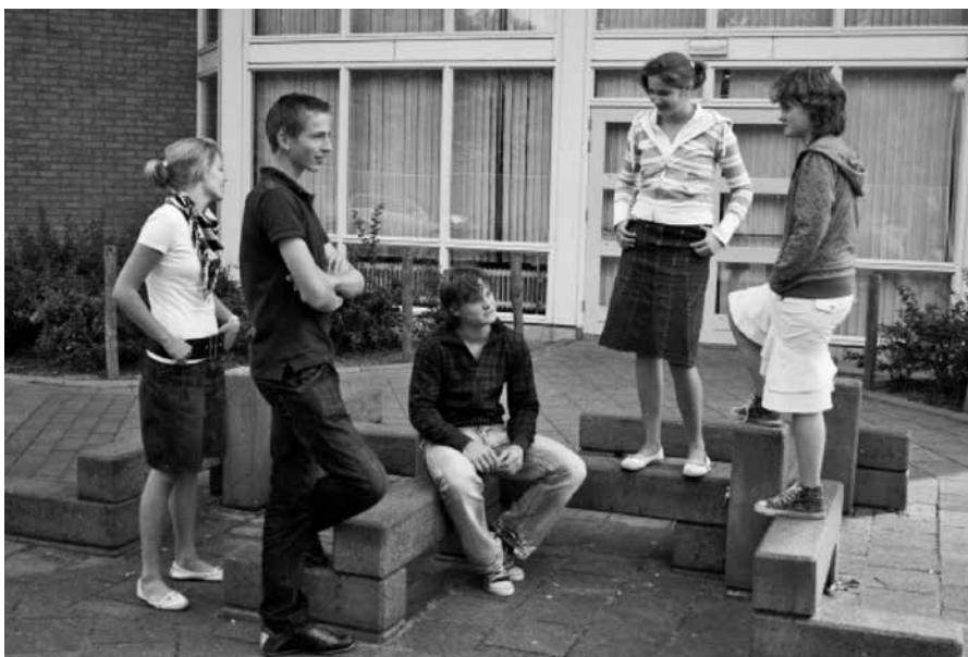
Wat jongeren bindt aan het Woord, is het leven naar het Woord, leven vanuit het Woord in woord en daad.