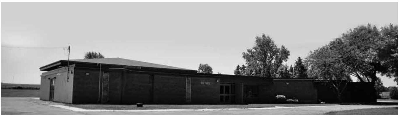
Kerkgebouw van de gemeente van Brant County, het vroegere Ancaster.