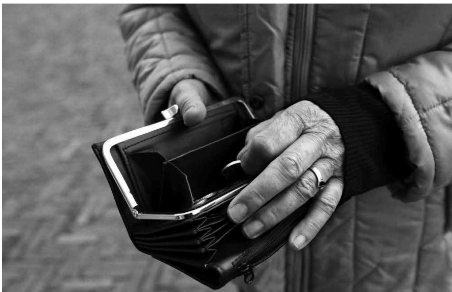
Het uitdelen van de gaven beperkt zich dus niet alleen tot de leden van de gemeente. Ook de vreemdeling en de bijwoner moeten in de armenzorg delen.

Gedrongen door de liefde van Christus zal de kerk moeten proberen anderen voor het koninkrijk van God te winnen, zonder geweld te doen aan de waarheid van het rechtvaardige