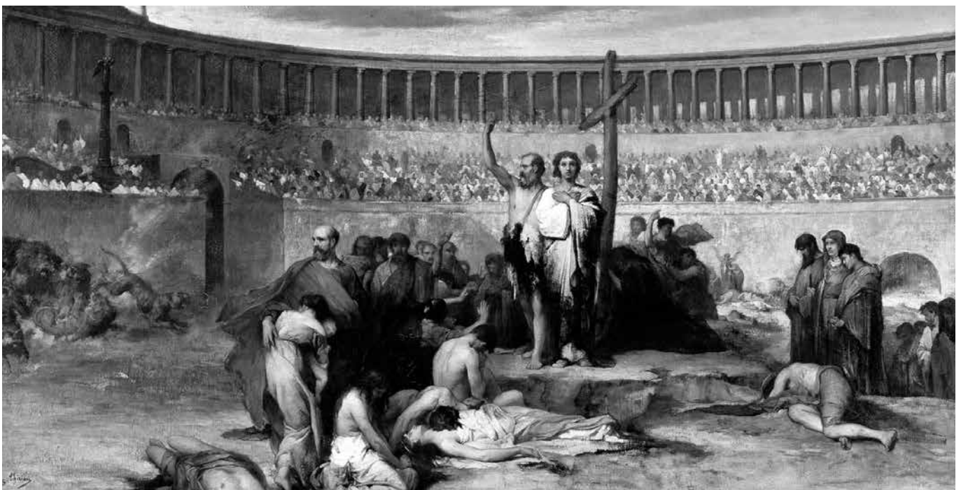
Hoeveel christenen zijn er eigenlijk nog veel eerder, in de eerste eeuwen, dus lang voor de Reformatie, gedood?

Ná de verdrukking en vervolging bleek het gemakkelijker en vooral voordeliger om te geloven. Dus de kerk bleef groeien. Maar anders dan voorheen. Christenen kregen een relatief veilige positie. In de loop der eeuwen ontwikkelde zich een christelijke cultuur.