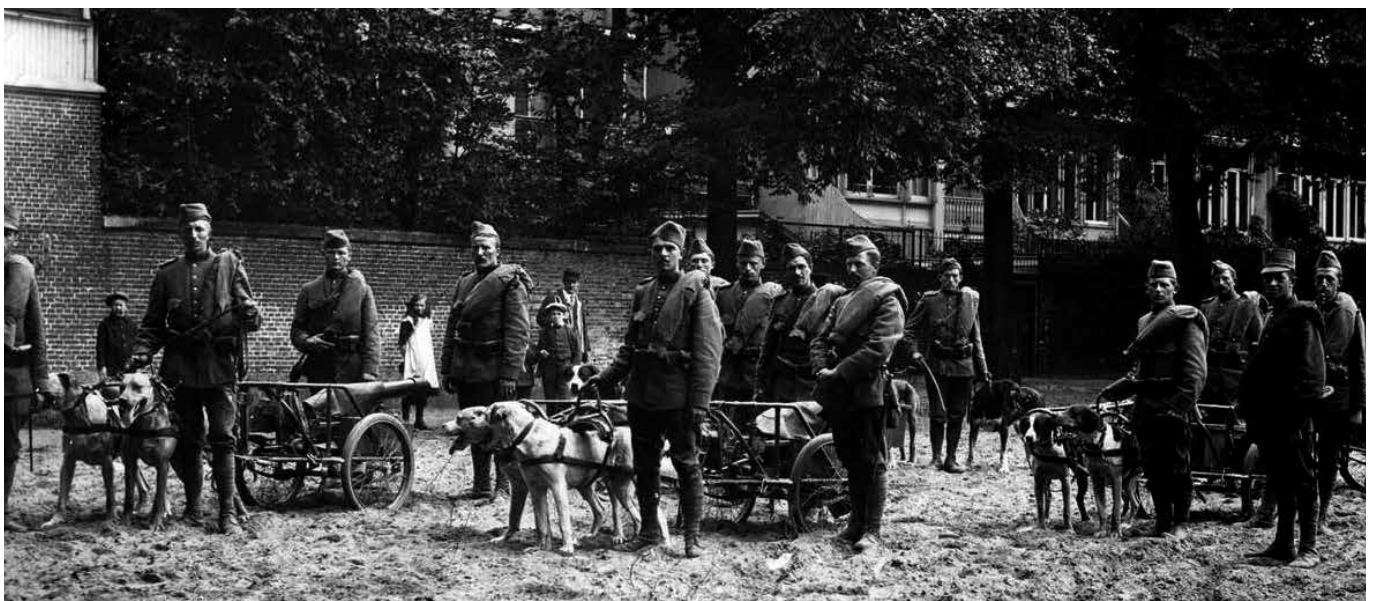
Mobilisatie van het Nederlandse leger.