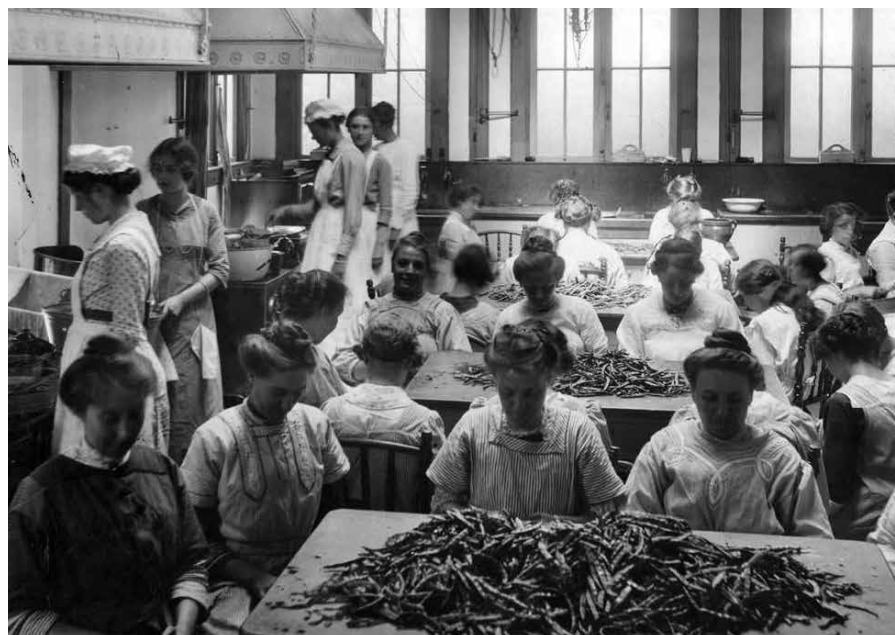
Vrouwen maken groenten gereed voor Nederlandse soldaten. Amsterdam, 1914.

De Zeeuwse oefenaar wees op het oordeel van 'de schaarste in allerlei ar-