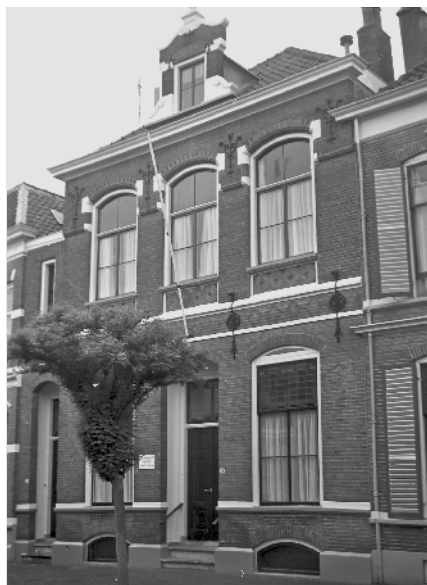
Kerkgebouw van de Gereformeerde Gemeente van Deventer.

Er staan verschillende mooie en leerzame zaken in dit boek. De kerk, de zending, de evangelisatie, het ledenverloop, de consulenten, het kerkelijke leven, etc. komen allemaal aan orde. Een predikant die regelmatig verzuchtte dat het mogelijk wel niet zou gaan deze avond werd voorzichtig maar beslist door Diepeveen erop gewezen dat hij een preek bij zich had. De zuchtende prediker kon dus rustig