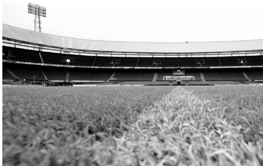
Is er niet ergens een tussenweg mogelijk? God wat en de (voetbal)wereld wat?

Wedstrijden in Brazilië kunnen tegenwoordig live over heel de wereld gevolgd worden. TV-schermen treft men overal aan, tot in de armzaligste krotten toe. Een reis naar Brazilië om daar van nabij de wedstrijden te volgen, is tegenwoordig wel niet voor iedereen maar wel voor grote aantallen mensen betaalbaar.