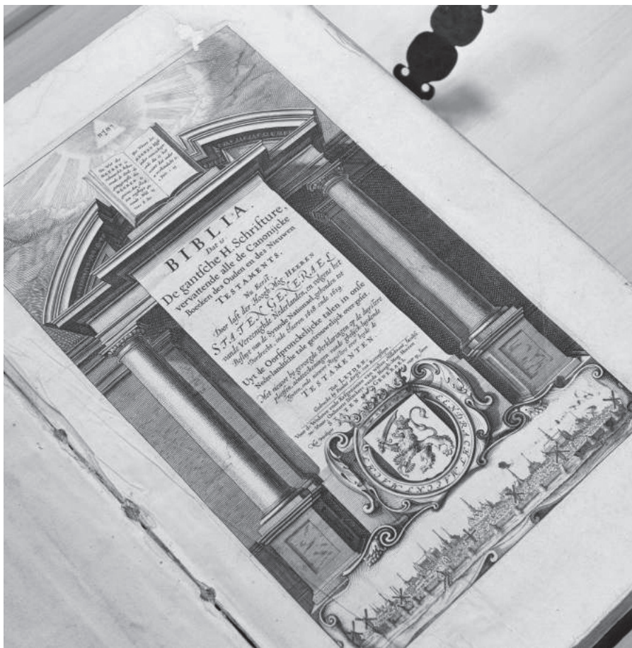
Voorpagina van de oorspronkelijke Statenvertaling: Uyt de Oorspronckelijcke talen in onze Neder-landtische tale getrouwelijck over-gezet.

Waarom heeft de HSV hier gekozen voor het woordje "moeten"? Het antwoord op deze vraag is te vinden in de toelichting die men geeft op de vertaling van een soortgelijk vers (Exodus 12:14). Ik citeer: 'Het hulpwerkwoord 'zullen' heeft twee hoofdbetekenis- sen, nl. 'moeten, verplicht zijn' en 'aangeven dat iets in de toekomst of van nu aan gaat gebeuren'. In de eerste betekenis is het sterk aan het verouderen (...). Dat betekent dat de