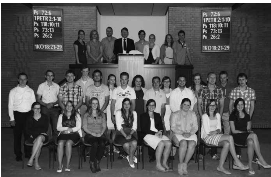
Het is een voorrecht dat op zoveel plaatsen jonge mensen wekelijks onderwijs ontvangen in de geloofsleer.

Jonge vrienden en vriendinnen, ga niet weg onder een Schriftuurlijk-bevindelijke prediking, ook al gaat Gods Woord in zijn scherpte tegen je eigen verlangens in. De Heere bracht je in Zijn aanbiddelijke wijsheid en goedheid in de Gereformeerde Gemeenten, waarin je op allerlei manieren gewezen wordt op de noodzaak en de mogelijkheid(!) van wedergeboorte, geloof en bekering. Je bent er onder