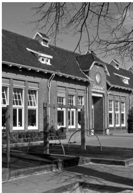
Ouders, toon oprechte belangstelling bij het onderwijs.

Af en toe krijgen onze scholen opmerkingen van ouders over een kind met een beperking in de klas. Helaas