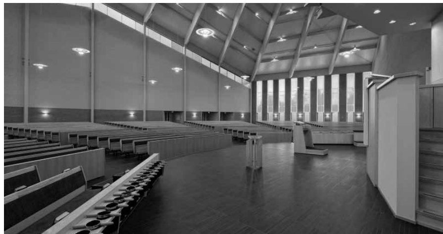
Kerkenraadsbank Gereformeerde Gemeente Scherpenzeel.

Bij zulke zaken moeten we vooral en nadrukkelijk ambtelijk en zorgvuldig denken en handelen. Dat moet steeds voorop staan en van daaruit moeten we onze overwegingen maken. Dit goed beseffend mogen we vervolgens, waar dat verantwoord is, ook best nuchter en praktisch zijn.