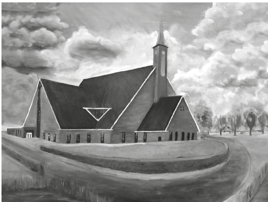
Impressie van het nieuwe kerkgebouw van de Gereformeerde Gemeente Yerseke.

De titel van de uitgave 'Twee tempelgangers' is ontleend aan de zevende van de negen preken over Lukas 18 vers 13: de gelijkenis van de farizeeër en de tollenaar.