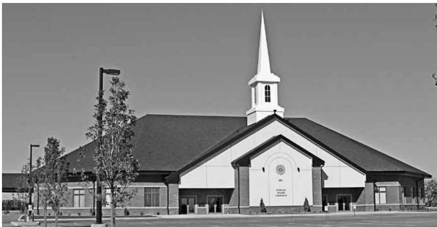
Het kerkgebouw van de gemeente Lethbridge.

Of je weet dat het in Michigan koud is in de winter of hoe koud het er is, omdat je het aan den lijve ervaren hebt, dat maakt wel een verschil. Het is ook een wezenlijk verschil of we weten dat mijn zonden en ellende groot zijn en dat ik daarvan verlost word en dat ik God daarvoor dankbaar ben, of dat ik