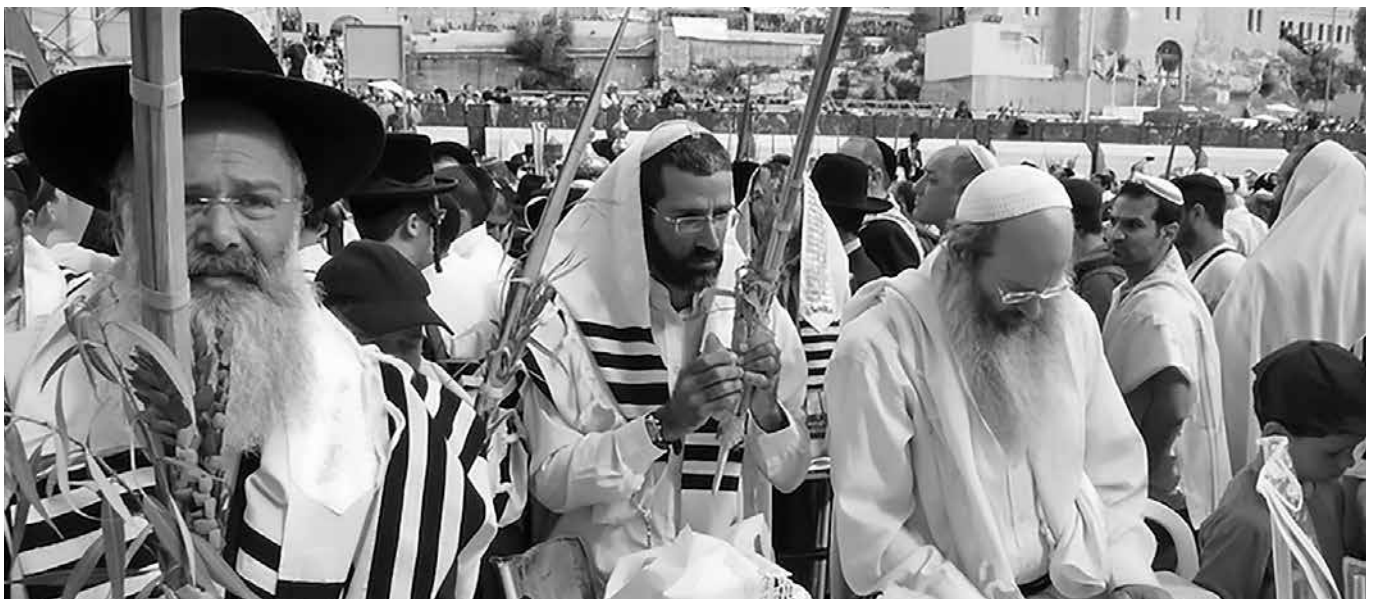
Wie nu terug wil naar de wettische vormen, wendt de blik af van Christus en van Zijn verdiensten.

We zouden graag zien dat de schrijvers van de brochure studie maakten van de brief van Paulus aan de Galaten. Paulus moest het ook opnemen tegen hen die 'dagen, en maanden, en tijden, en jaren' wilden vasthouden, en vreesde dat hij het Evangelie onder hen tevergeefs verkondigd had (Gal. 4:10,11). Paulus houdt ons niet voor om weer oudtestamentische feesten in te voeren, maar hij begeerde dat Christus gestalte kreeg in de Galaten (vers 19). Maar dan moest 'de dienst-