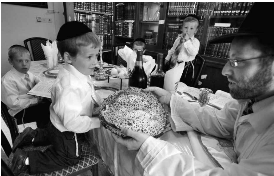
Er is nog hoop voor Israël! Er is nog hoop voor u en uw kinderen!

Dat was ook de opvatting van een jonge vader die in een koffiepauze om een persoonlijk gesprekje vroeg. Uit zijn verhaal bleek een zee van ellende. Het ging niet meer tussen hem en zijn vrouw en hij dacht al aan scheiden. Toen ik hem vroeg of er - bijbels gesproken - grond voor een echtscheiding was, schudde hij meewarig zijn hoofd.