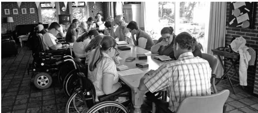
Het Woord mag - vaak in eenvoudige bewoordingen - aan het hart worden gelegd.

Bent u iemand of kent u iemand met een beperking die graag eens mee wil gaan met een van onze vakantieweken? Of lijkt het u/jou fijn als staflid deel te nemen? Kijk dan voor meer informatie op onze website www.vakantiewekenvbagg.nl . Voor vragen kunt u ook mailen naar: cvb.secretarisse@vakantiewekenvbagg.nl of bel (0345)571926.