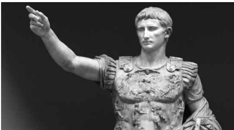
Augustus acht het nodig een bevel, een gebod uit te vaardigen, dat de 'gehele wereld' beschreven moet worden.

vervuld. Zijn tijd, de volheid des tijds is aangebroken en de keizer in Rome zal eraan meewerken dat Gods belofte heerlijk wordt vervuld.