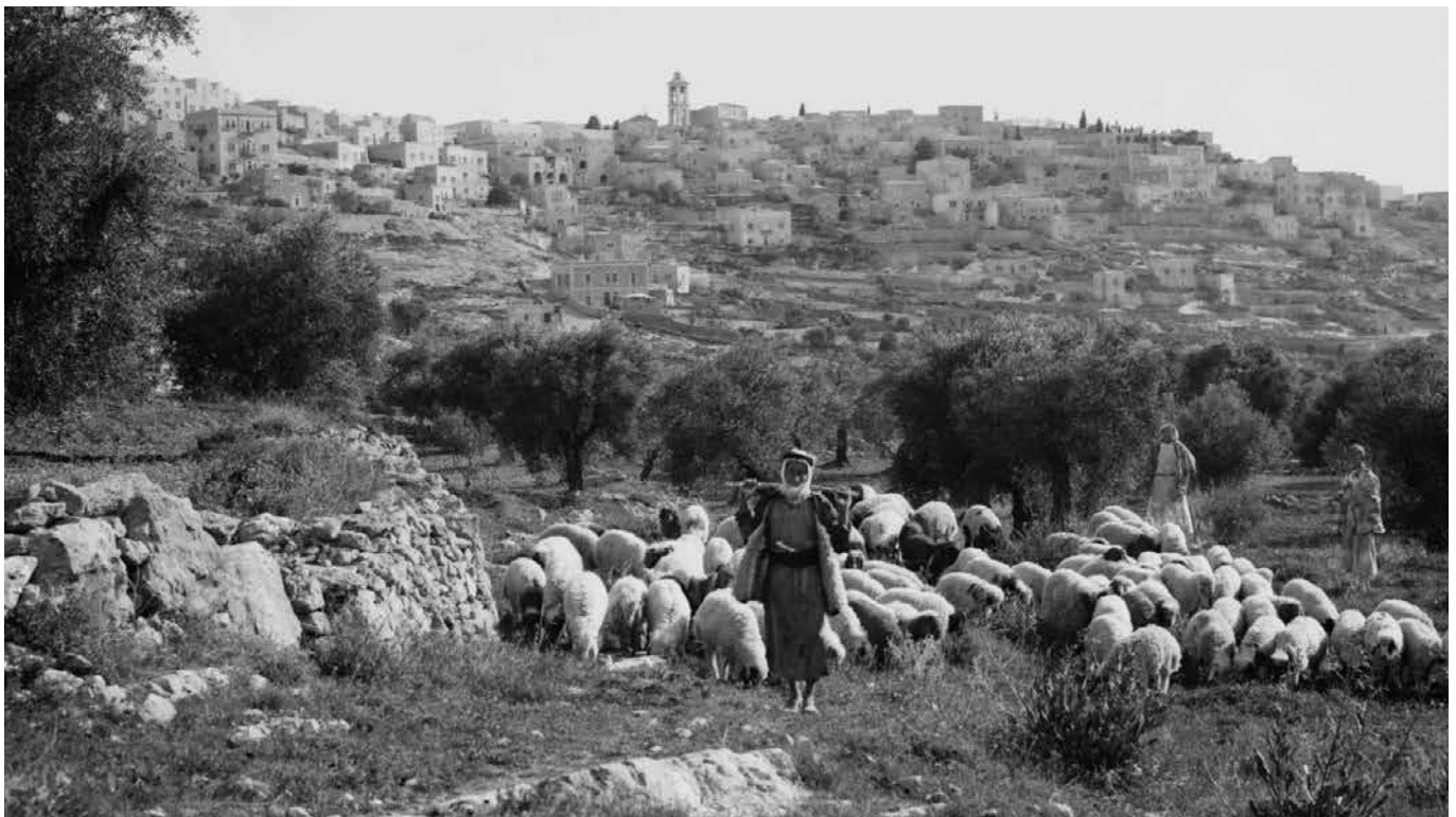
Bethlehem betekent letterlijk "broodhuis". Werd daar wellicht veel koren verbouwd? Eén ding is zeker: Bethlehem is het broodhuis in geestelijk opzicht. Hier werd Hij geboren Die het Brood des levens is.

Bethlehem betekent letterlijk "broodhuis". Werd daar wellicht veel koren verbouwd? Eén ding is zeker: Bethlehem is het broodhuis in geestelijk opzicht. Hier werd Hij geboren Die het Brood des levens is. Hier worden hongerige zielen verzadigd met het vette van Gods huis. Weet u daarvan? Van nature kennen wij die honger niet. Wij hebben ons de dood gegeten