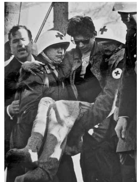
Het 'wonder van Lengede' in 1963.