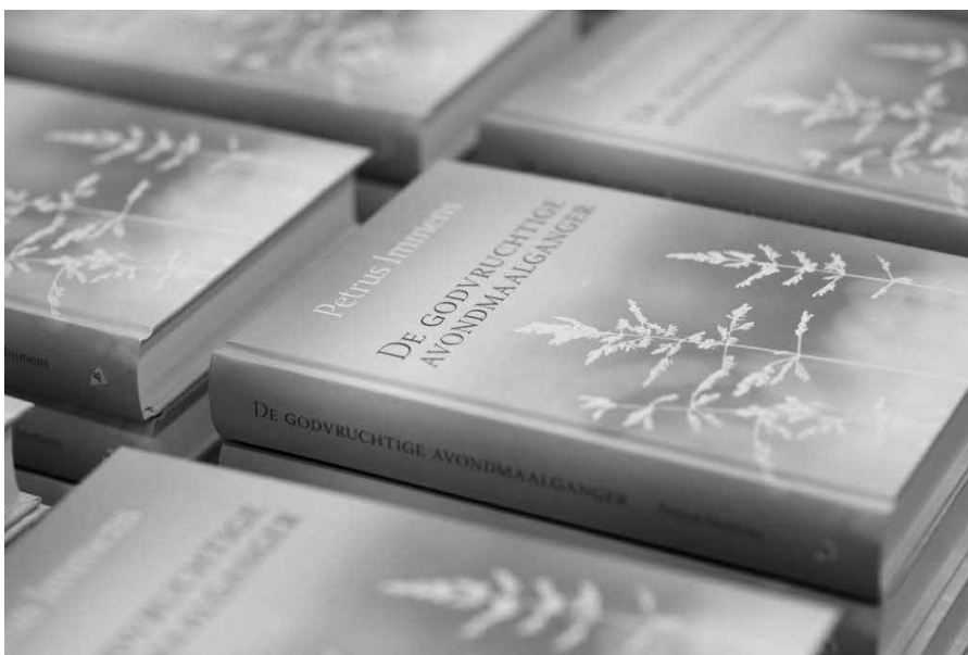
Een voortdurende nabetrachting is nodig. Zo worden de gelovigen ook weer voorbereid op een nuttig gebruik van het volgende Avondmaal.