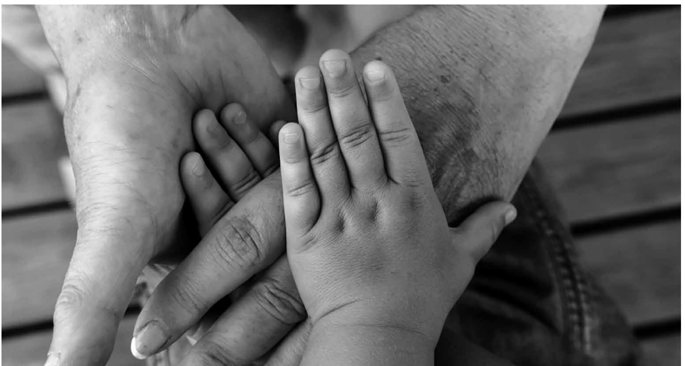
Een arme zondaar, die Gods genade ervaart, begeert altijd van harte zijn naaste te vergeven.

In de woorden 'van harte' (dat wil zeggen: met ons hele hart) zit iets onvoorwaardelijks. We wachten niet af of de ander wel de eerste stap zet. Voornemen betekent: echt willen komen tot de daad van vergeven. Of de ander die vergeving aanvaardt of niet, doet niet ter zake.