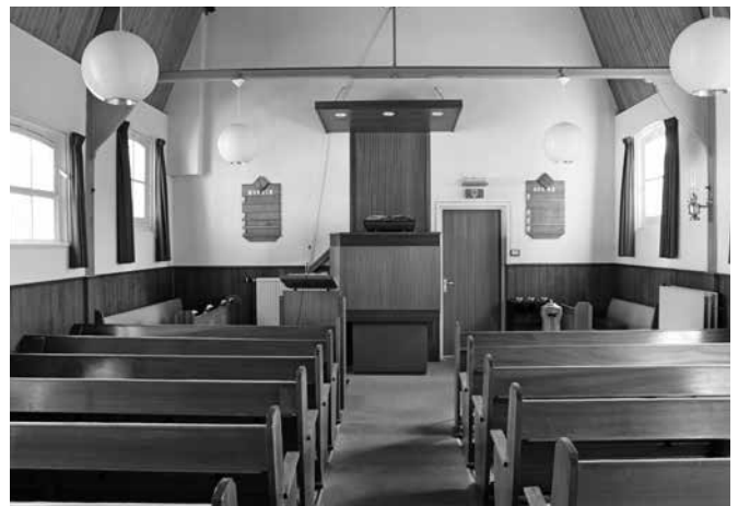
Interieur van het kerkgebouw.