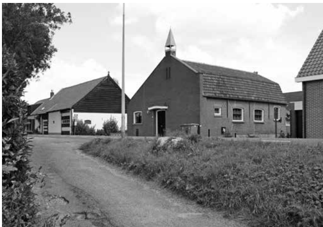
Exterieur van het kerkgebouw.