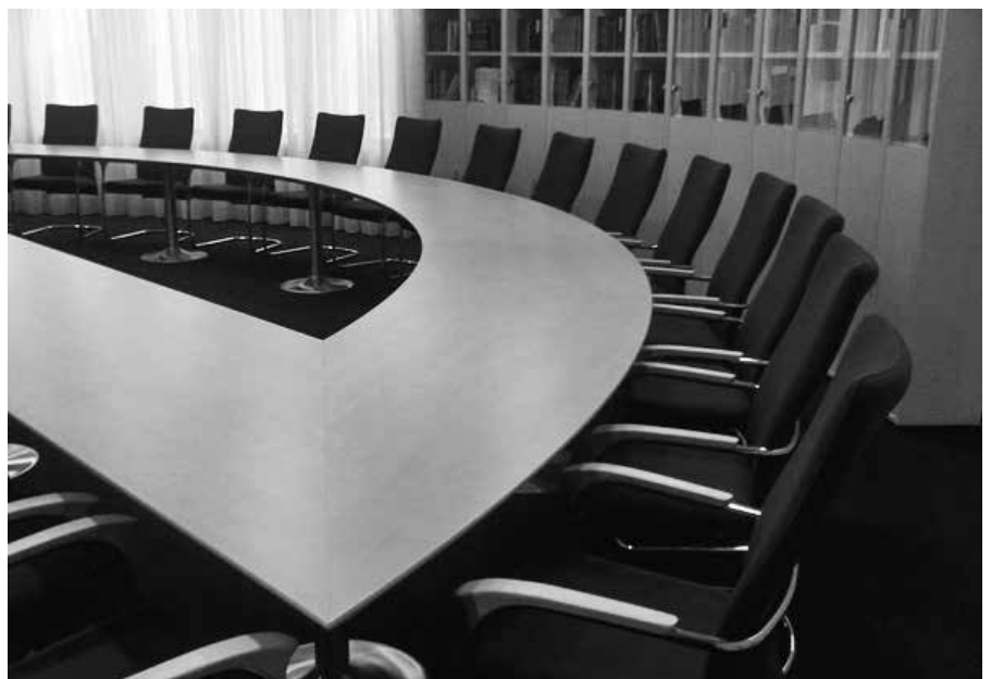
De Heere geeft vaak leiding vanuit Zijn Woord door Zijn Geest.