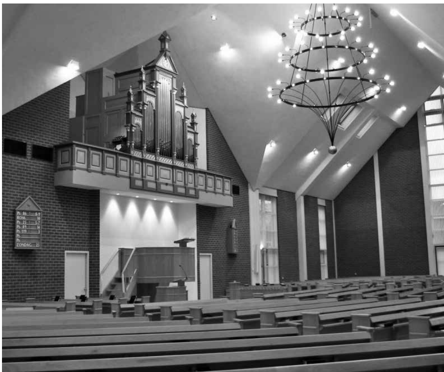
Belijdenis doen moet niet in een opwelling gebeuren.

Dit kunnen we alleen maar beamen. Stel dat wij een jonge man, die de vraag zou stellen, zouden antwoorden, dat hij gerust zonder hartvernieuwende genade belijdenis kan doen, omdat het immers slechts een belijdenis van de waarheid zou zijn. Hoe zouden we het doen van belijde-