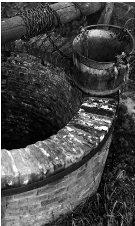
Allen putten uit dezelfde bron.