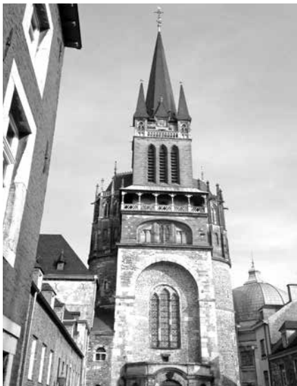
Dom van Aken.

We zijn een dagje in Aken en lopen de Aachener Dom op het Münsterplatz binnen. Grotendeels bewaard gebleven tijdens de Tweede Wereldoorlog. Deze Mariakerk is rond 800 gebouwd in opdracht van Karel de Grote. De keizer sterft in de ochtend van 28 januari 814 en is 's avonds al begraven. Hij ligt mogelijk in de 31 meter hoge Paltskapel. Naast marmeren zuilen en vloeren, zijn vooral de gewelven met duizenden mozaïektegeltjes heel indrukwekkend.