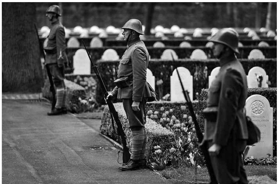
Op 10 mei vielen de Duitsers Nederland binnen; nu 75 jaar geleden.