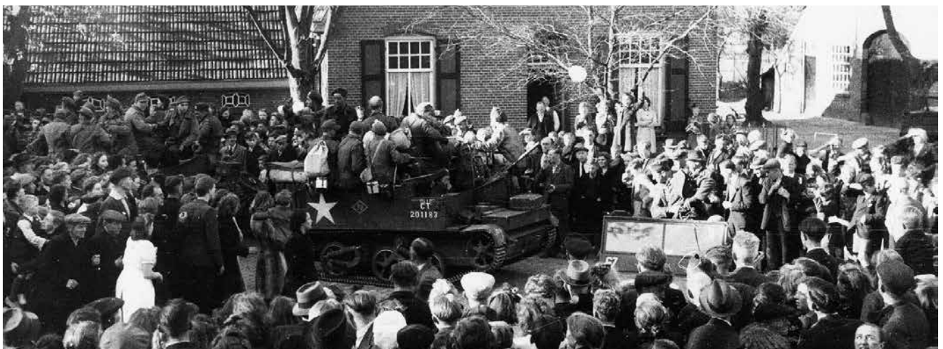
De Heere heeft ons in Zijn genade willen bevrijden van de wrede onderdrukker. Wat heeft ons volk nu met deze weldaden gedaan?