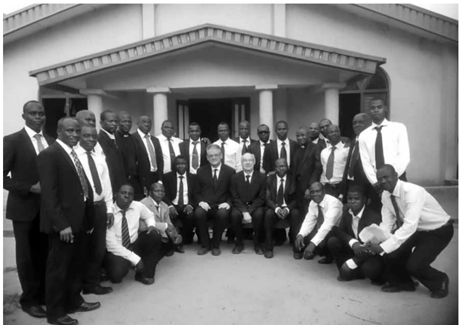
Het is bemoedigend om te zien dat de Heere voor Zijn kerk zorgt, ook in Nigeria.

De volgende dag bij de opening van de Synode mediteerde ds. J. Ebeke vanuit 2 Petrus 3:18 over de opwas in de genade. Niet groeien in eigen kracht maar in de kennis van Christus. Uitwending is er sprake van een groeiend aantal kerken en leden, maar is er ook geestelijke groei? Zijn we op onszelf gericht of op de eer van God? Het was een gepast openingswoord dat beslag legde op de vergadering.