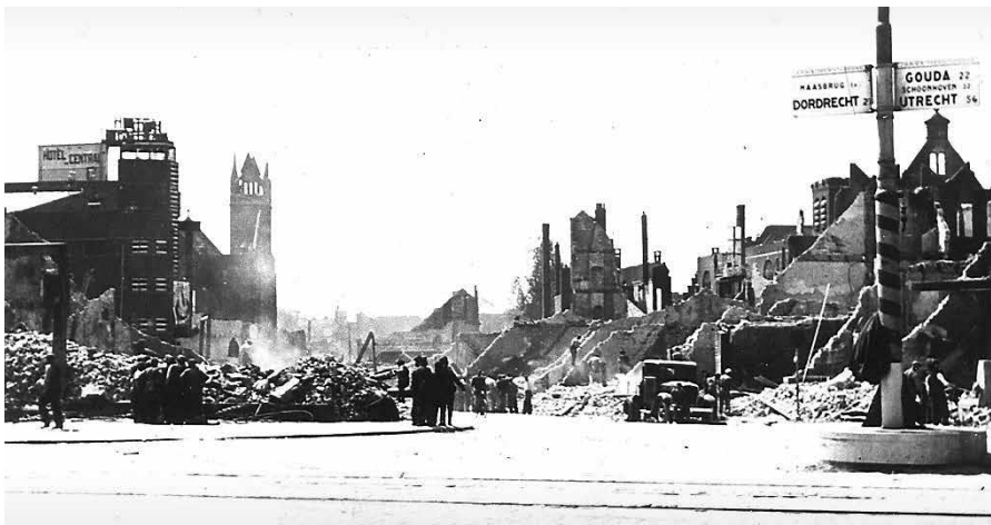
In Rotterdam-Centrum en Middelburg kwamen enkele gemeenteleden tijdens de aanvallen om het leven.