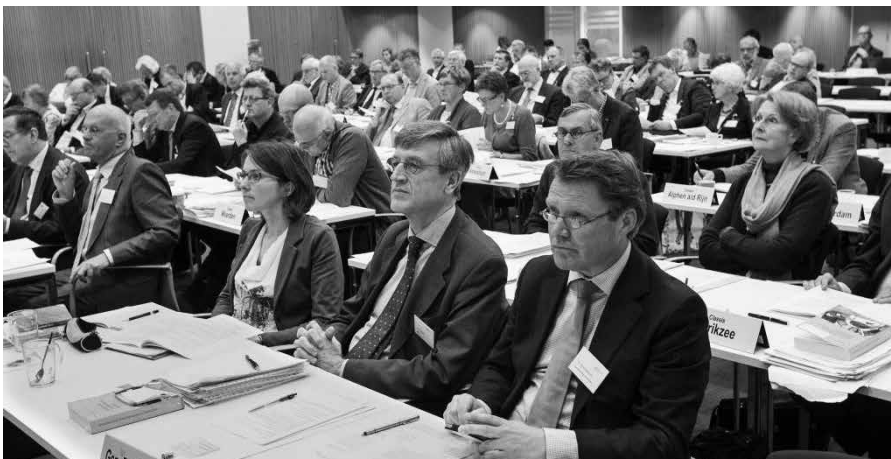
De Protestantse Kerk in Nederland hield dit voorjaar een enquête onder haar leden. Welke ideeën had men over de toekomst van de kerk?