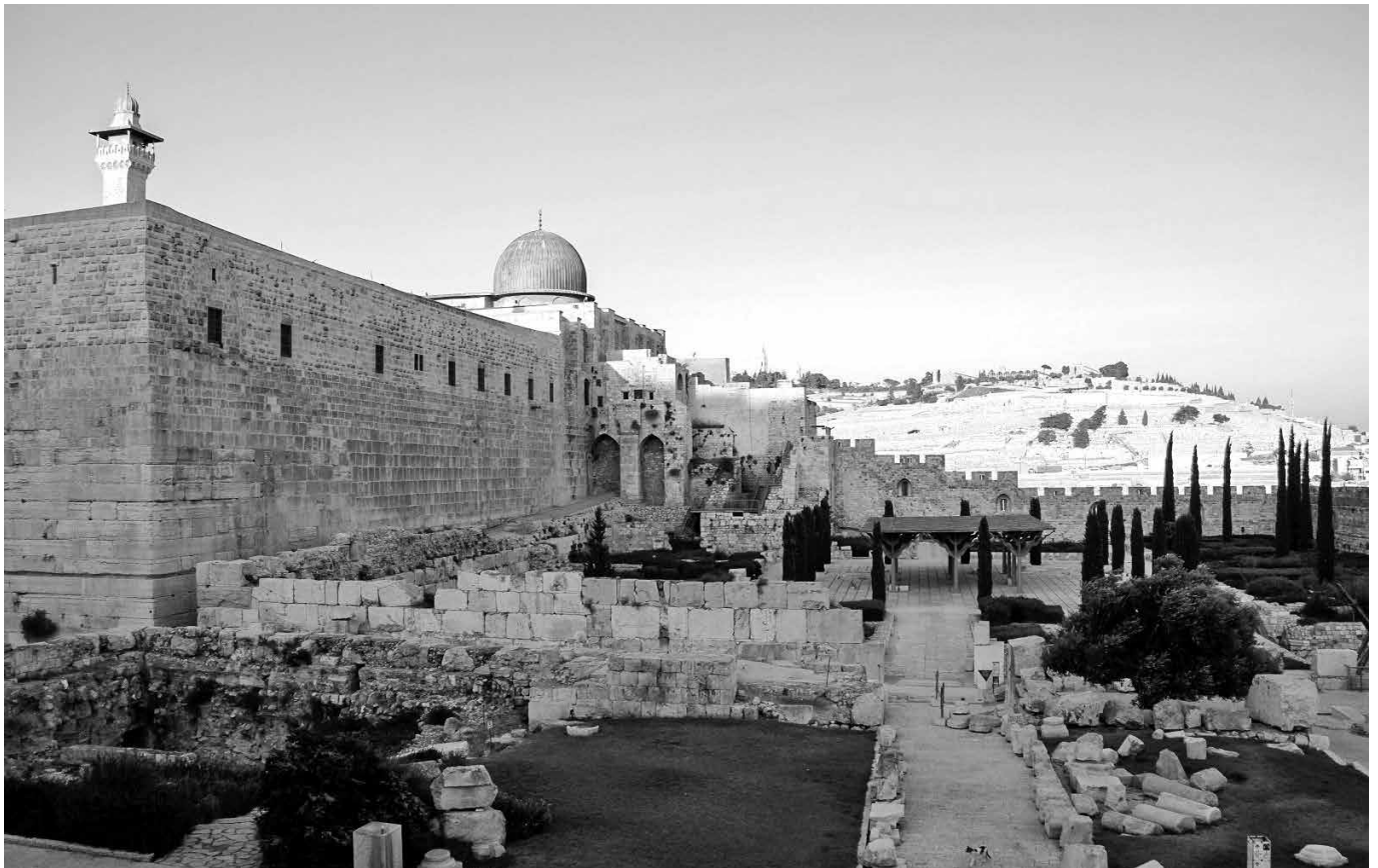
De oude stad Jeruzalem met op de achtergrond de Olijfberg.

U moet Hem vinden en Hij is niet ver weg. Met Zijn Lichaam is Hij op grote afstand, maar met Zijn Godheid, genade en Geest is Hij dichtbij.