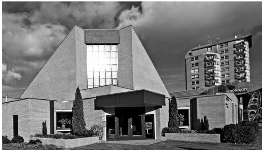
'Gedenkt den sabbatdag, dat gij dien heiligt'

'Gedenkt den sabbatdag, dat gij dien heiligt', luidt het vierde gebod. Wij lezen voor 'sabbat': de eerste dag van de week, de zondag. Ten onrechte, zo beweren onder meer Sabbatisten en Zevendedagadventisten. De eerste dag van de week is volgens hen niet in de plaats gekomen van de sabbat. Zij menen dat Gods gebod uitsluitend ziet op het heiligen van de 'oude' sabbat. Sabbat is sabbat. Pas eeuwen na de opstanding van Christus zou volgens hen de zondag zijn ingevoerd als rustdag.