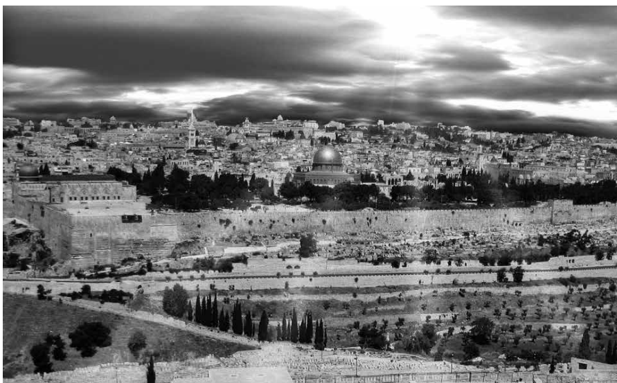
'Toen keerden zij wederom naar Jeruzalem.'