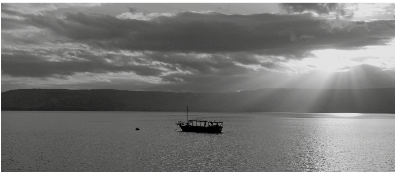
'Gij Galilese mannen...'

Hij zal alzo komen. Dat is, zegt de kanttekening, in zulker wijze, zicht-