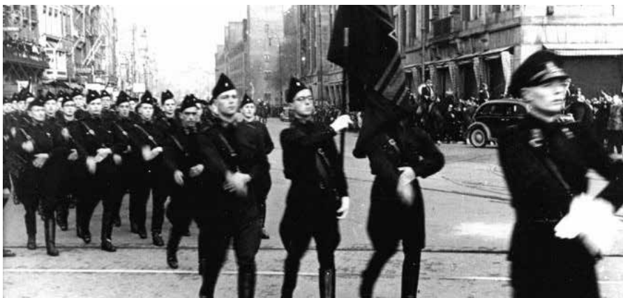
Jongeren die zich aangesloten hadden bij de NSB konden in de Gereformeerde Gemeenten niet zomaar belijdenis doen.