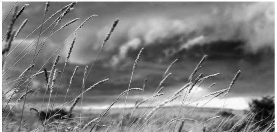
Gelijk een geweldig gedreven wind.