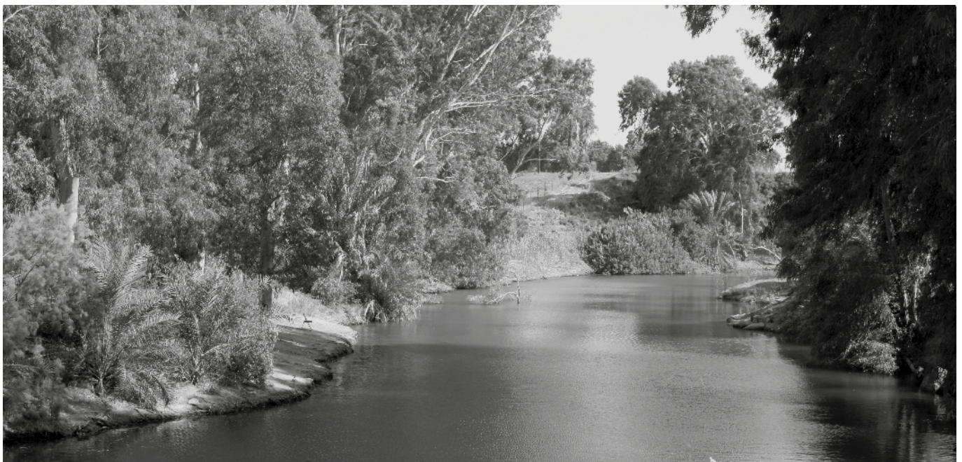
Jezus werd gedoopt in de Jordaan. '...en hij zag de Geest Gods nederdalen.'