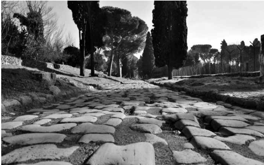
Op de Via Appia eindigde Paulus zijn zendingsreizen

Waar hebben de apostelen de moed vandaan gehaald om de heidenwereld in te gaan? Het Handelingenboek geeft daarop een antwoord. Zij ontvingen de moed en de kracht van de Heilige Geest. Dit was het wat Christus hen in het bijzonder beloofde bij Zijn hemelvaart: “Maar gij zult ontvangen de kracht des Heiligen Geestes, Die over u komen zal; en gij zult Mijn getuigen zijn, zo te Jeruzalem, als in geheel Judéa en Samaría, en tot aan het uiterste der aarde.” (Hand. 1:8).