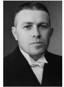
"De eerste preek die ik gelezen heb, was van wijlen ds. F.J. Dieleman".

Nog een laatste advies aan ambtsdragers: wees voorzichtig met de kleinen in de genade. Wees mild in de beoordeling van gedrag van jonge mensen. Wees lankmoedig, en wijs op de beloften Gods, Die nooit beschaamd zal laten staan degenen die tot Hem de toevlucht nemen. (wordt vervolgd)