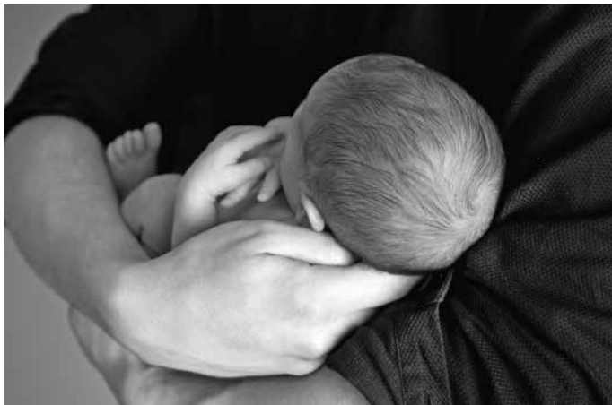
Een jonge moeder

Ik voel me blij en zo intens gelukkig en dankbaar. Ik sta aan de wieg van onze baby. En ik denk na: Vaccineren, ja of nee?