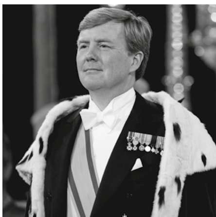
Willem Alexander, koning der Nederlanden bij de gratie Gods.

Weer wordt door D66 een poging ondernomen om de woorden ‘bij de gratie Gods’ te laten vervallen. Een initiatiefwet is daarvoor ingediend. De woorden ‘bij de gratie Gods’ maken deel uit van de aanhef van alle koninklijke besluiten en wetten die in het Staatsblad worden gepubliceerd. In 2010 en 2012 strandden die pogingen omdat er geen meerderheid voor was te vinden in de Tweede Kamer. Zullen die pogingen nu wel slagen?