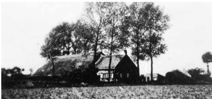
't Hof D' Palmboom, Bakkers boerderij tussen 's-Gravenpolder en Baarland.