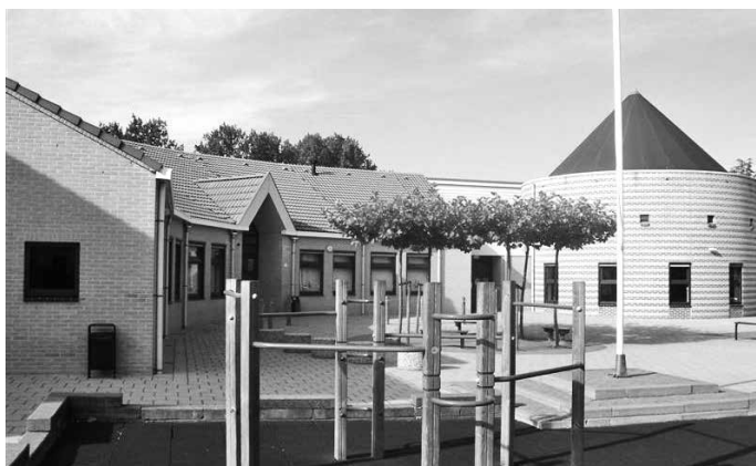
Ds. G.H. Kersten- school, Ridderkerk

Waarom vragen we uw aandacht voor de verhouding 'bestuur'