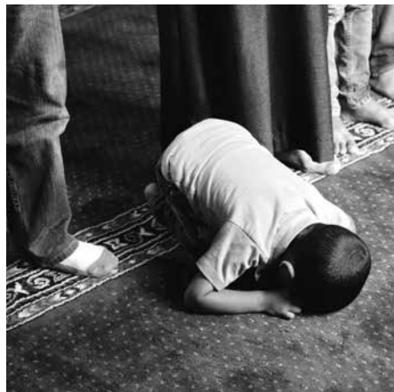
De islam is in de opmars. Ze mag allerlei vormen hebben, maar haar groei is explosief en haar zending doelgericht.

Was het grootspraak van Mohammed Ali of meende hij werkelijk wat hij schreef? Eén ding is duidelijk: de islam is bezig aan een vrijwel onstuitbare opmars. Dat geldt niet alleen Azië en Afrika, maar ook Amerika en Europa. Op dit moment zijn er 1,6 miljard moslims in de wereld. Als het huidige tempo aanhoudt zullen dat er in 2050 meer dan 2,7 miljard zijn (bijna 1/3 van de wereldbevolking). Aan het eind van deze eeuw kan de islam het christendom getalsmatig hebben ingehaald. Volgens het gezaghebbende Pew Research Center zal het aantal Europese christenen dan zijn afgenomen met 100 miljoen. Nu kunnen onderzoekers zich vergissen en komen prognoses niet altijd uit. Gelukkig ligt de toekomst in Gods hand. Als Hij het wil, ontstaat er zelfs een opwekking onder Joden en heidenen. Dat neemt echter niet weg dat de Bijbel spreekt over een grote afval en de opkomst van vele valse profeten in de eindtijd. Wat dat betreft zijn er zorgwekkende ontwikkelingen. Ongeveer 5 % van de Europese bevolking is thans moslim. Rekenen we Rusland en Turkije mee, dan ligt dat percentage nog