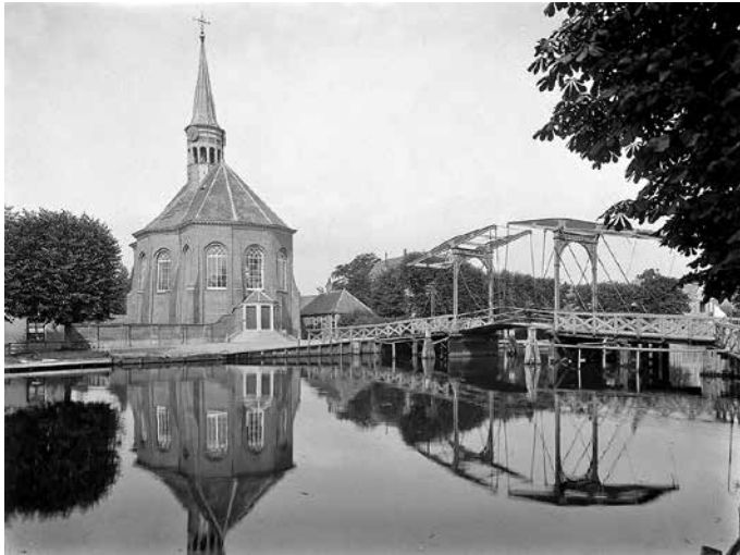
Woubrugge was Comries enige standplaats.

Alexander Comrie (1706-1774) is een theoloog die onze Gereformeerde Gemeenten diepgaand heeft beïnvloed. Het is met name ds. G.H. Kersten geweest door wie deze invloed tot stand is gekomen. Hij heeft immers, zoals bekend, gezegd dat hij Comrie heeft ‘vermalen’.