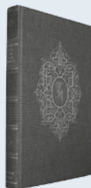
ds. G.H. Kersten Uit: "Meer dan overwinnaars"

Daarentegen zijn vele namen verzwegen, waardiger genoemd te worden dan deze! Dwaas, vijandig mensenkind! Zal Gods souvereiniteit u dan steeds een aanstoot blijven? De Heere keurt zo geheel anders dan wij. Hij gaat voorbij degenen op wie wij het oog vestigen. Hij neemt hen, die bij ons het minst zijn geteld. Uit de diepten van zonden en verachting en vergetelheid haalt Hij Zijn werk en Zijn volk op en geeft de verheerlijkte genade getuigenis. Dat leert ons een enkele blik op de rij der getuigen, die Paulus in Hebreeën 11 noemt. En die hij opent met Abel.