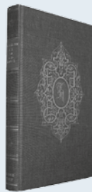
ds. G.H. Kersten Uit: "Meer dan overwinnaars"