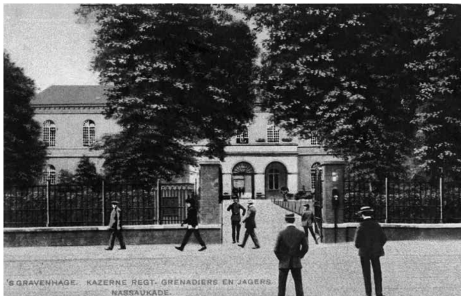
De kazerne van het Regiment Grenadiers en Jagers te 's-Gravenhage