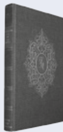
ds. G.H. Kersten Uit: "Meer dan overwinnaars"

Henoeh wandelde met God driehonderd jaren lang. En de vorm waarin het werkwoord wandelen geplaatst is, wijst op een gedurig herhalen der werking. Henoeh, zo wil Mozes zeggen, wandelde met God op en neer.