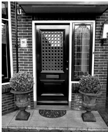
Het contact met gemeenteleden kan iets avontuurlijks hebben.

Is daar nog tijd en gelegenheid voor? Ik vrees van niet. Maar misschien zijn het toch juist deze bezoeken die belangrijk kunnen zijn in de gemeente. Bezoeken kunnen vaak zo formeel zijn. Er wordt gecondoleerd, gefeliciteerd, naar de welstand gevraagd en naar de aard der gelegenheid wordt er wat gelezen en gebeden. En we gaan weer.... Het gevaar van formaliteit en voorspelbaarheid is dan zeker niet denkbeeldig; mensen merken dat. Ik wil het niet over deze bezoeken hebben maar meer over het 'gewone', extra bezoek. Een (nader) kennismakingsbezoek. Ik wil u er enkele gedachten over delen. Uit de praktijk uiteraard.