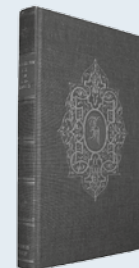
ds. G.H. Kersten Uit: "Meer dan overwinnaars"

Maar zonder geloof is het onmogelijk Gode te behagen. Want die tot God komt, moet geloven dat Hij is, en een Beloner is dergenen, die Hem zoeken.