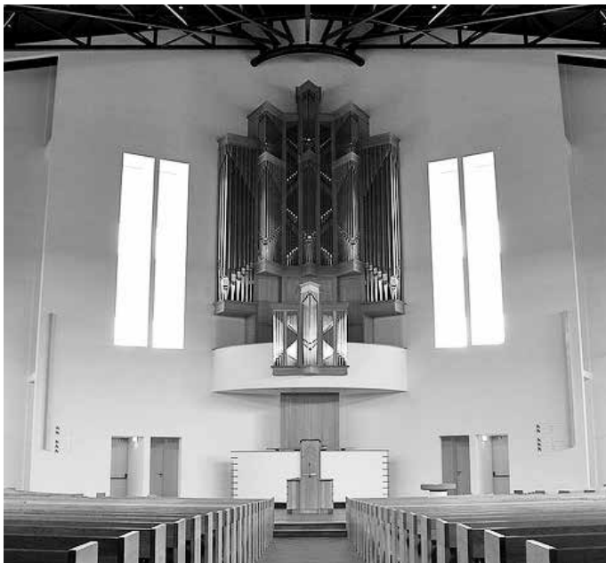
Kerkenraad Gereformeerde Gemeente Tricht- Geldermalsen

Op 18 september was het 25 jaar geleden dat ds. P. Mulder, predikant van onze gemeente Tricht-Geldermalsen, tot dienaar van het Goddelijke Woord werd bevestigd. Aan een reeks arbeidzame jaren in het onderwijs kwam daarmee een einde.