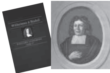
Wilhelmus à Brakel (1635-1711), de "Redelijke Godsdienst"