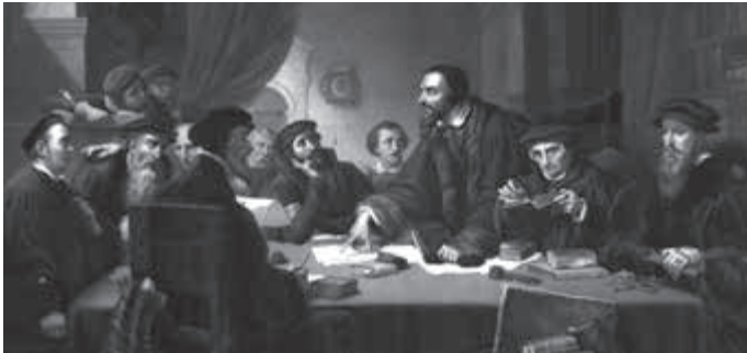
Calvin: tweeërlei kinderen